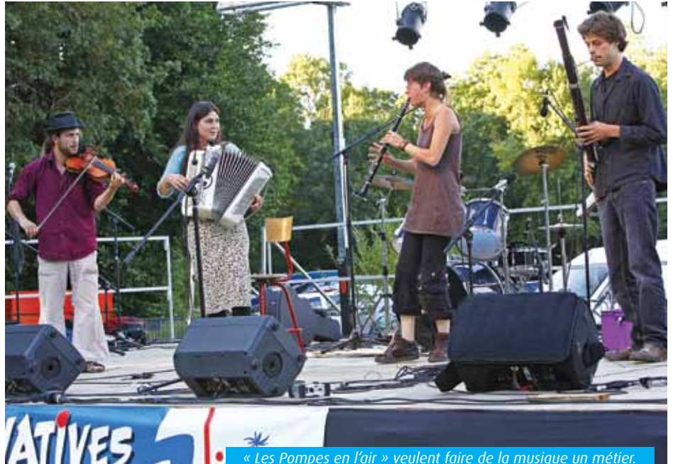
« Les Pompes en l'air » veulent faire de la musique un métier.

Vivre de la musique, un vœu pieux pour le groupe « Les Pompes en l'air ». Ses quatre membres poitevins s'adonnent aux musiques traditionnelles juives de l'Europe de l'Est avec l'espoir de toucher, un jour, le Graal du professionnalisme. Dans l'attente, la passion sert un destin commun. L'utopie, généralement inhérente à tous ces musiciens en herbe, est pour eux caduque. « Nous nous donnons les moyens de réussir », s'exclament-ils. L'investissement est total et d'autant plus louable que la musique Klezmer, courant dans lequel ils s'inscrivent, nécessite une pratique sans frein. Accumulant les scènes, la bande des quatre saisit ainsi chaque occasion pour faire résonner les rythmiques tonitrueuses de cette veine musicale. « C'est une musique de