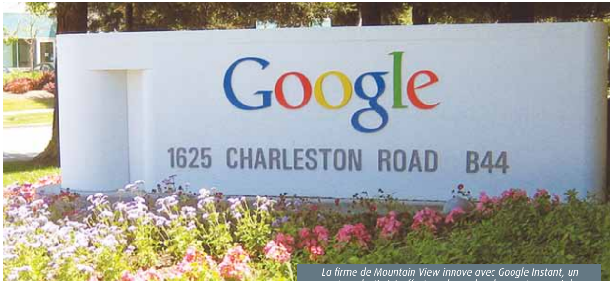
La firme de Mountain View innove avec Google Instant, un moteur destiné à effectuer des recherches en temps réel.

La nébuleuse Google vient d'ajouter une nouvelle corde à sa panoplie avec Google Instant. Loin de se contenter d'être le leader incontesté des moteurs de recherche, la firme californienne cherche en permanence de nouveaux moyens de faire fructifier sa rente de situation. Avec « Instant », l'internaute va gagner... du temps. Beaucoup de temps même. Le principe ? Il suffit de taper la première lettre d'un mot clé pour que les puissants algorithmes se mettent en route. L'avantage ? Ajuster immédiatement sa recherche en fonction des résultats obtenus. Seul bémol : l'accès à « Instant » est