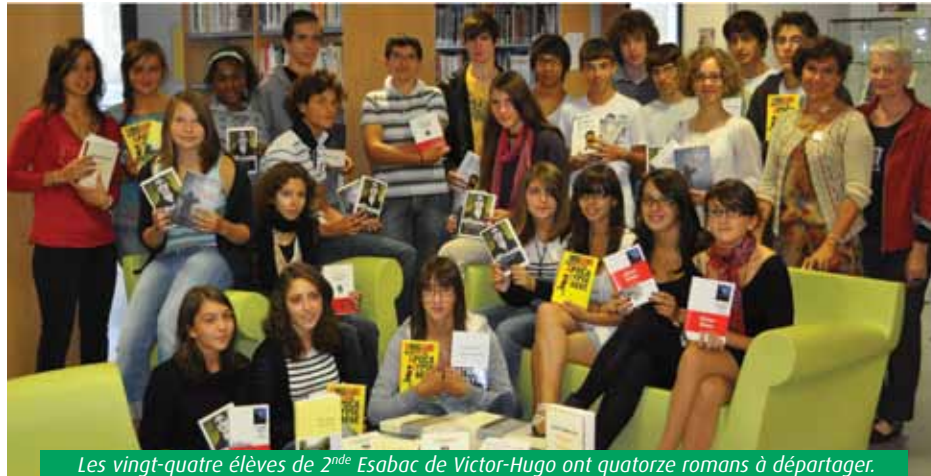
Les vingt-quatre élèves de 2 nde Esabac de Victor-Hugo ont quatorze romans à départager.

Ces petits pionniers ne sont plus à un privilège près. Celui que viennent de leur accorder