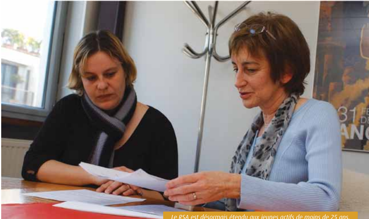
Le RSA est désormais étendu aux jeunes actifs de moins de 25 ans.

L'extension du Revenu de solidarité active aux jeunes de moins de 25 ans est désormais effective. Le nombre de bénéficiaires potentiels dans la Vienne est estimé à 1 300.