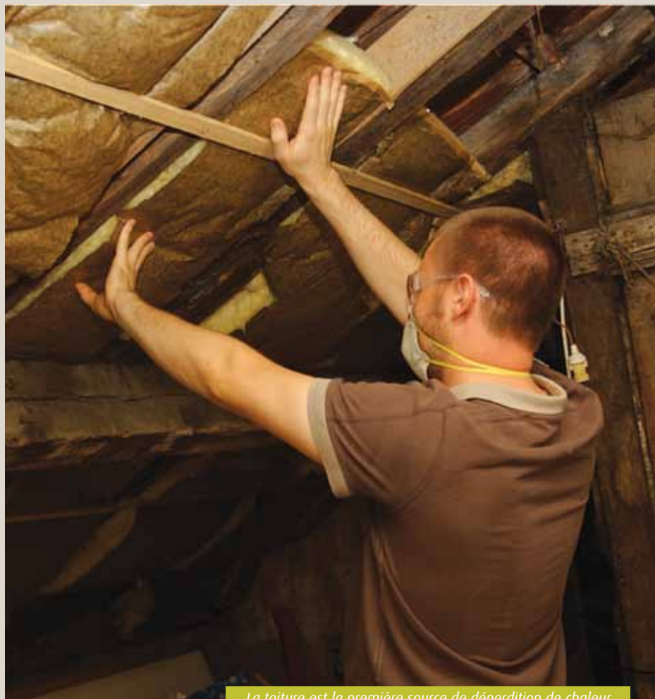
La toiture est la première source de déperdition de chaleur.

Plus facile et moins chère, cette méthode reste la plus bénéfique puisque la toiture est responsable de 30% de la déperdition de chaleur. Au plancher ou entre les solives, les matériaux les plus courants sont les laines de verre, de roche ou de chanvre, la ouate de cellulose et le polystyrène expansé. A noter que l'isolation extérieure, enfermant la maison dans une sorte de bulle, est encore plus efficace mais aussi plus onéreuse.