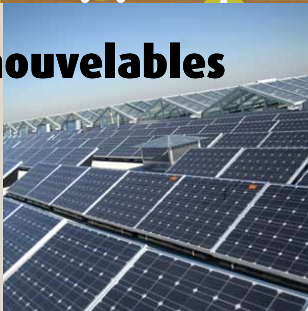
Le photovoltaïque transforme la lumière du soleil en électricité

Les + : Idéal pour chauffer l'eau utilisée au quotidien (douche, lavabo, vaisselle...). Les panneaux peuvent être posés sur la toiture, sans démonter les tuiles. L'étanchéité du bâti est préservée. Le coût est minime (de 4 000 à 6 000€, pose