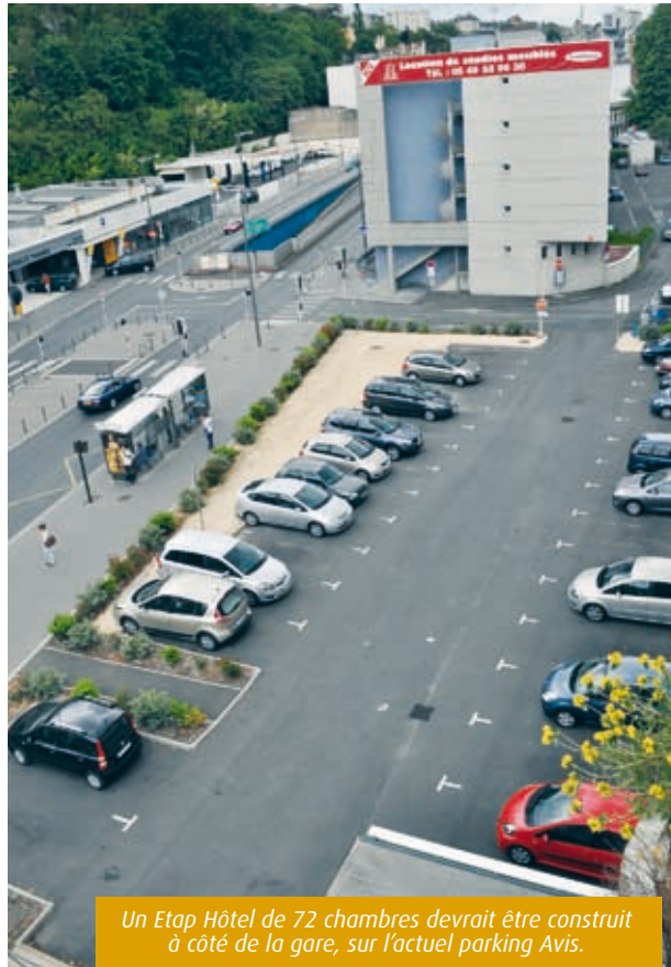
Un Etap Hôtel de 72 chambres devrait être construit à côté de la gare, sur l'actuel parking Avis.

Quant à la commercialisation des espaces restauration, elle est elle aussi en bonne voie. Les murs de la brasserie de luxe de l'atrium et des petits restaurants périphériques de l'étage ont ainsi été cédés à deux autres investisseurs, eux aussi Poitevins ou d'origine