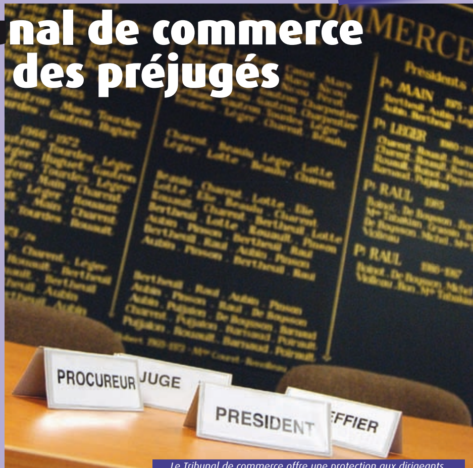
Le Tribunal de commerce offre une protection aux dirigeants.

Contrairement à d'autres, le Tribunal de commerce est avant tout fréquenté par des "clients" et non des "justiciables". Et cette nuance a toute son importance. "Le greffe enregistre les créations d'entreprise, les modifications de statuts, les comptes annuels. Il diffuse les extraits Kbis et l'état de nantissement des entreprises, impayés, gages sur le matériel... Autant d'informations nécessaires dans les relations entre clients et fournisseurs",