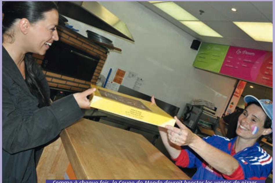
Comme à chaque fois, la Coupe de Monde devrait booster les ventes de pizzas.