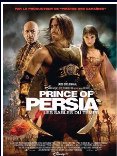
Prince of Persia. Film d'aventure (2h06) de Mike Newell, avec Jake Gyllenhaal, Gemma Arterton, Ben Kingsley et Alfred Molina. A l'affiche au CGR Castille et au MEGA CGR de Buxerolles.

Le dernier film de Mike Newell débarque en conquérant sur les écrans. Dastan y incarne un héros qui court, saute et virevolte dans tous les sens. Décoiffant !