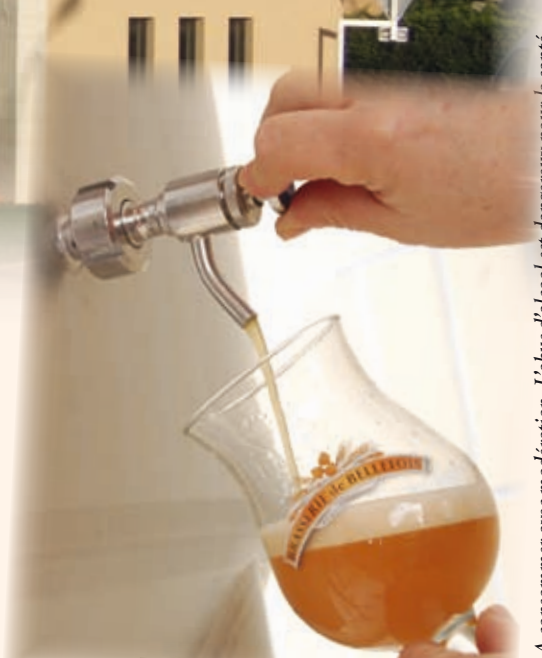
A consommer avec modération. L'abus d'alcool est dangereux pour la santé.