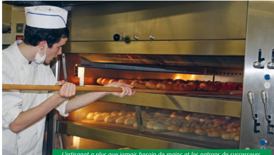
L'artisanat a plus que jamais besoin de mains et les patrons de successeurs.