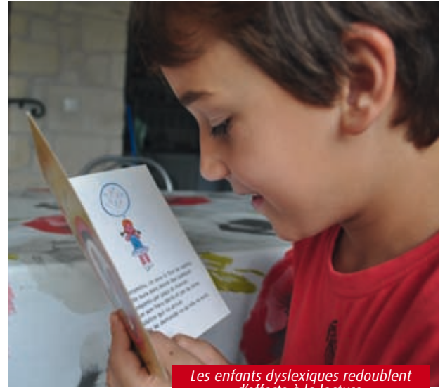
Les enfants dyslexiques redoublent d'efforts à la lecture.

Alors, comment diagnostiquer leurs difficultés ? Pour le médecin, cela ne fait aucun doute, l'entrée en CP est un mur. "La dyslexie se révèle au début du primaire. S'il y a un décalage avec les autres élèves en CE2 sur la compréhension de l'écrit, il faut vite agir." Il insiste : "Notre collaboration avec le corps enseignant est exemplaire. Les instituteurs sont de mieux en mieux formés et c'est à eux que revient