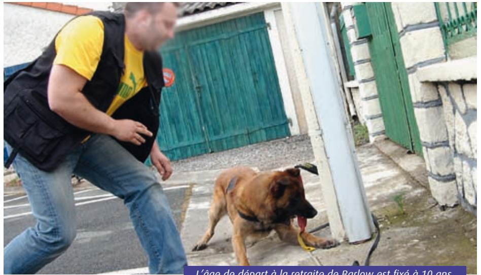
L'âge de départ à la retraite de Barlow est fixé à 10 ans.

Après un an passé au centre national de formation des unités canines de Cannes Ecluse (Seine-Maritime) et trois mois de spécialisation dans la recherche de drogues, le champion est d'attaque. "Nous