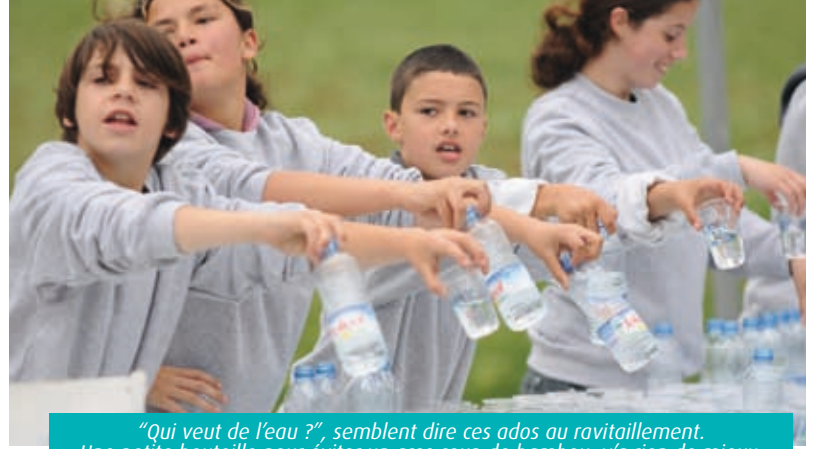
"Qui veut de l'eau ?", semblent dire ces ados au ravitaillement. Une petite bouteille pour éviter un gros coup de bambou, y'a rien de mieux.