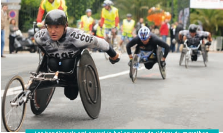
Les handisports ont ouvert le bal en lever de rideau du marathon.