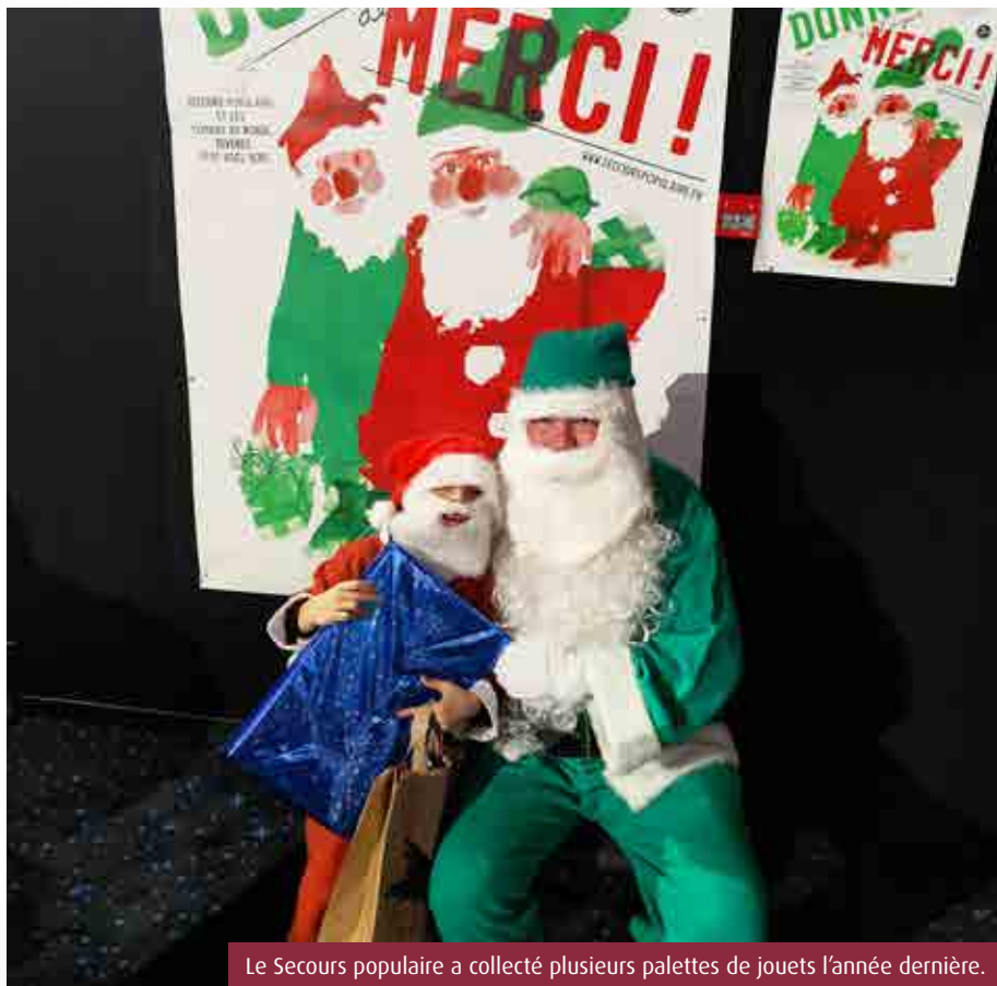
Le Secours populaire a collecté plusieurs palettes de jouets l'année dernière.