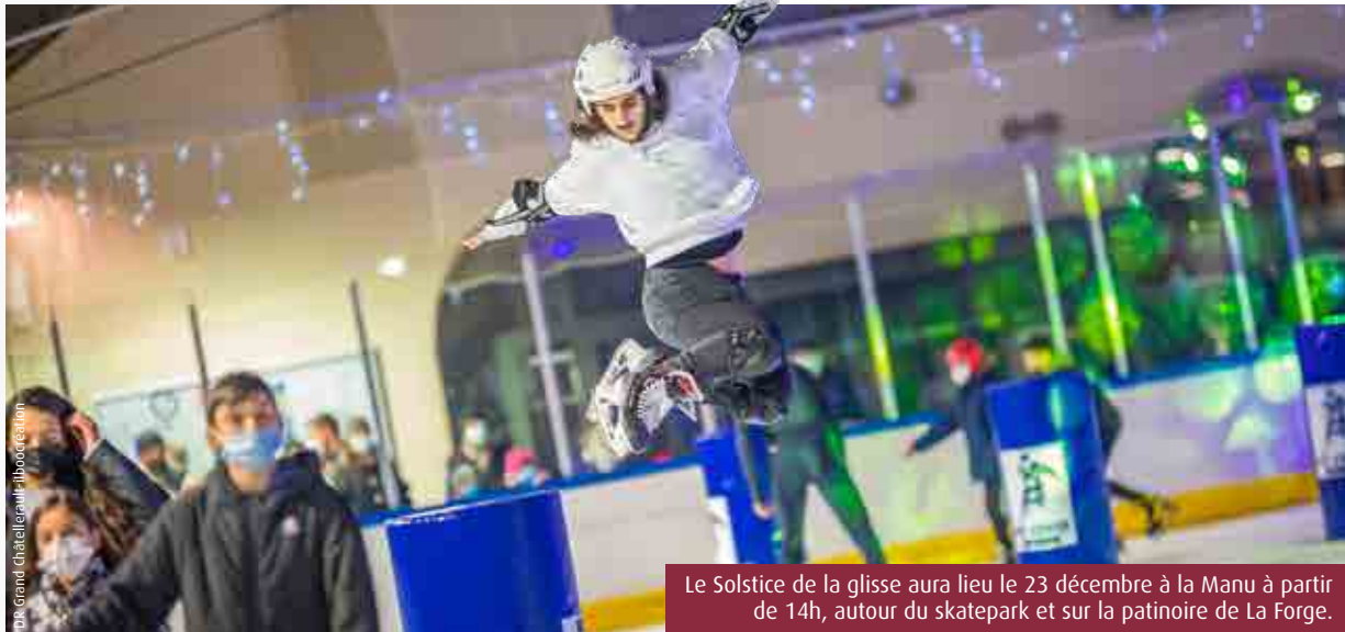
Le Solstice de la glisse aura lieu le 23 décembre à la Manu à partir de 14h, autour du skatepark et sur la patinoire de La Forge.

Voici venue la fin de l'année et avec elle son cortège de rendez-vous festifs. A Châtelleraut, le lancement des illuminations vendredi précèdera le marché de Noël et bien d'autres animations pour petits et grands.