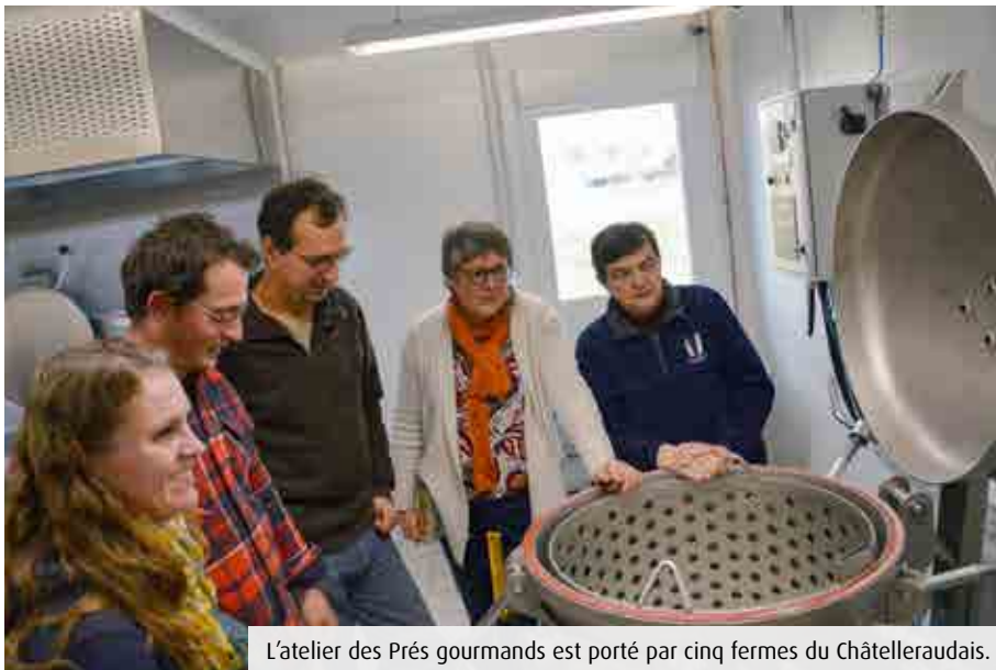
L'atelier des Prés gourmands est porté par cinq fermes du Châtellerauldais.

Le flambant neuf Atelier des Prés gourmands a aussi bénéficié de l'accompagnement du Centre d'initiatives pour valoriser l'agriculture et le milieu rural (Civam). Outil collectif pensé pour satisfaire tous les agriculteurs souhaitant transformer eux-mêmes leur production, il comprend cinq chambres froides, un