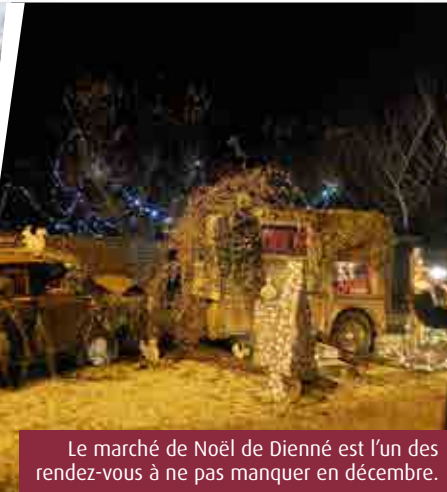
Le marché de Noël de Dienné est l'un des rendez-vous à ne pas manquer en décembre.