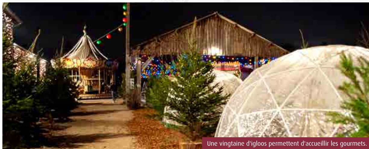
Une vingtaine d'igloos permettent d'accueillir les gourmets.

La Guinguette pictave, à Poitiers, jusqu'au 7 janvier, du mardi au vendredi de 17h à 2h et les samedi, dimanche et pendant les vacances de 12h à 2h.