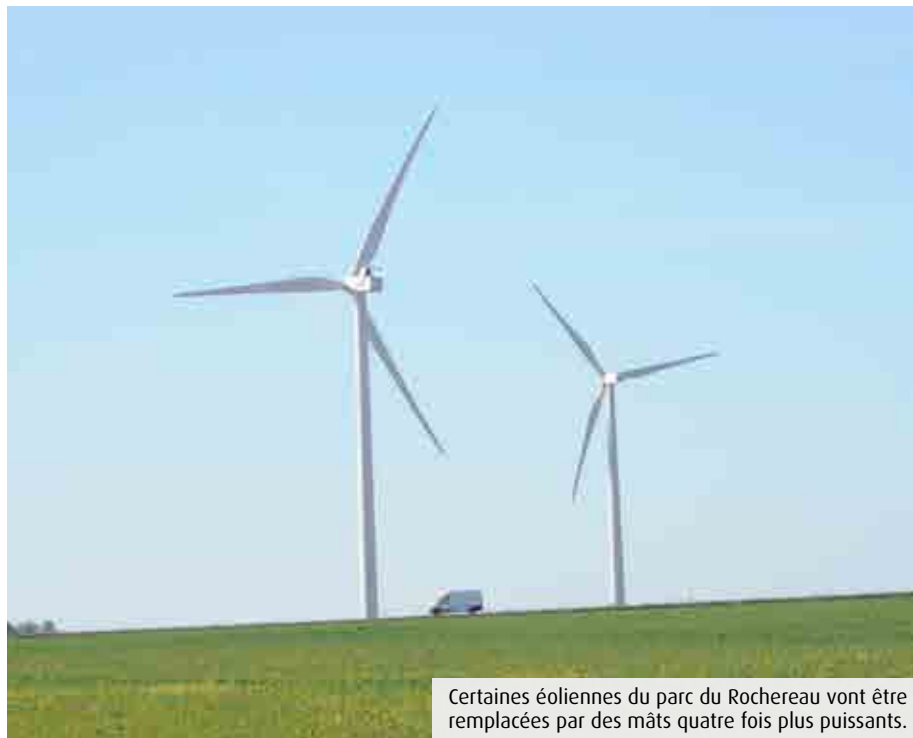
Certaines éoliennes du parc du Rochereau vont être remplacées par des mâts quatre fois plus puissants.