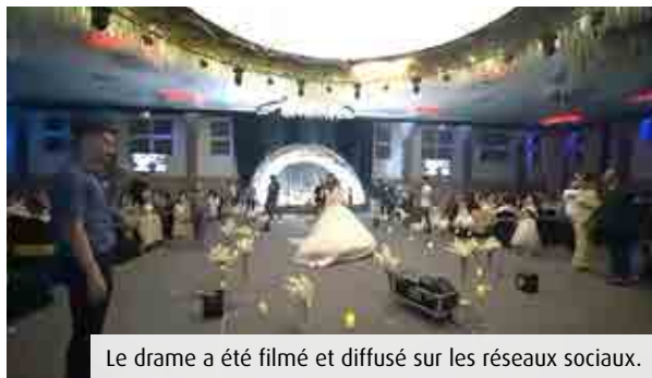
Le drame a été filmé et diffusé sur les réseaux sociaux.

Les chrétiens d'Orient vivent depuis des années sous la menace de milices chiites. C'est d'ailleurs ce qui a poussé les Atalah à fuir d'abord vers le nord du pays puis vers la France lorsque l'Etat islamique faisait régner la terreur dans la région de Mossoul, en 2016. « Nous n'étions plus en sécurité et vivions sous la menace permanente d'attentats. » Aujourd'hui, selon nos confrères de La Croix, des milices chiites poursuivent le même objectif : conquérir le territoire, sous l'influence de l'Iran. La place des chrétiens chaldéens comme des syriens-catholiques se retrouve de fait menacée. Depuis dix ans, une dizaine de familles de Chrétiens d'Orient ont trouvé refuge à Poitiers, accueillies par la communauté de Salvart, à Migné-Auxances.