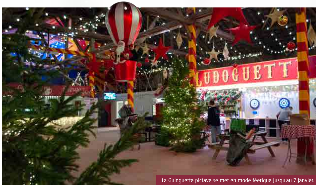
La Guinguette pictave se met en mode féerique jusqu'au 7 janvier.

L'îlot Tison, à Poitiers, n'échappe pas à la féerie de Noël. Illuminations, carrousel, marché de créateurs, douceurs salés et sucrés... En bord de Clain, tous les ingrédients sont réunis pour plonger dans l'ambiance des fêtes de fin d'année.