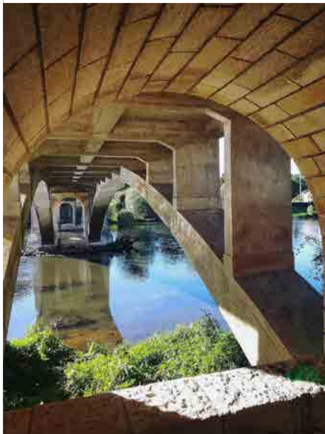
Sous le pont de la commune de Saint-Martin-la-Rivière (86).

Suivez la communauté Instagramers Poitiers (@igers_poitiers) et utilisez #igers_poitiers sans modération pour participer aux prochaines sélections et être informé de l'actualité de la première communauté française de photographie mobile.