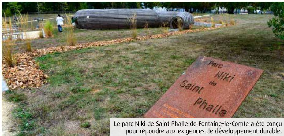
Le parc Niki de Saint Phalle de Fontaine-le-Comte a été conçu pour répondre aux exigences de développement durable.

La remise des prix des Victoires du paysage 2022, organisées depuis 2008 par Val'Hor, aura lieu le 3 décembre prochain. Le parc Niki de Saint Phalle de Fontaine-le-Comte figure parmi les 63 aménagements encore en lice (8 en Nouvelle-Aquitaine) et compte parmi les 5 nominés au niveau national dans la catégorie « infrastructure ». « La sélection 2022 reflète d'ores et déjà la prise de conscience des collectivités de toutes dimensions et des maîtres d'ouvrage privés sur des nombreux bienfaits du végétal : santé, lien social, pro-