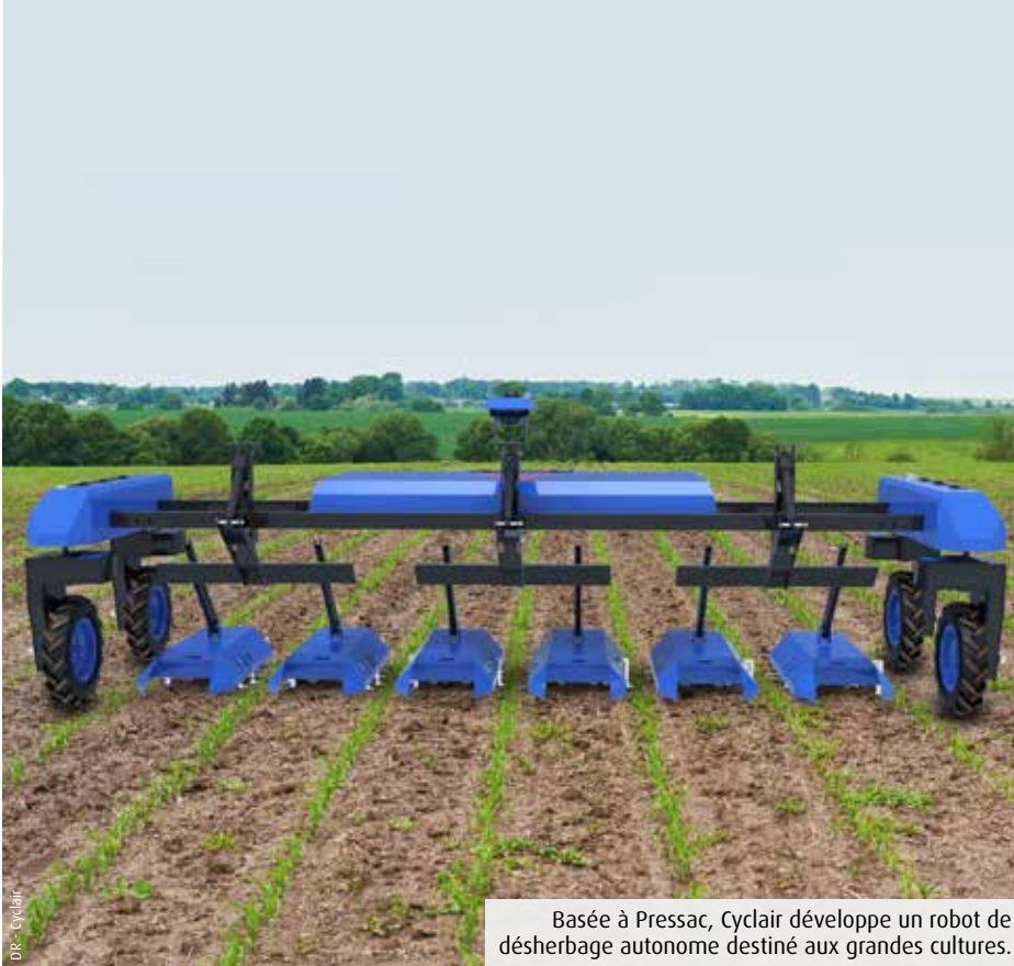
Basée à Pressac, Cyclair développe un robot de désherbage autonome destiné aux grandes cultures.

Créée à Pressac, dans le Sud-Vienne, Cyclair développe une solution de désherbage mécanique et autonome pour grandes cultures, notamment grâce à l'intelligence artificielle. Elle fonctionnera au printemps 2023 dans des fermes de la Vienne.