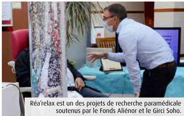
Réa-relax est un des projets de recherche paramédicale soutenus par le Fonds Aliénor et le Girci Soho.