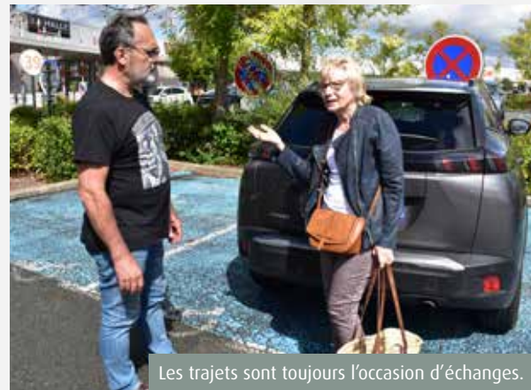
Les trajets sont toujours l'occasion d'échanges.

Les seniors constituent la grande majorité des bénéficiaires du transport solidaire. Au-delà de son aspect pratique, le dispositif est un vecteur de lien social.