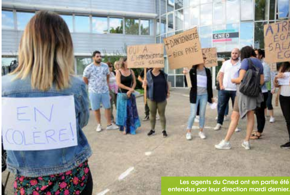
Les agents du Cned ont en partie été entendus par leur direction mardi dernier.