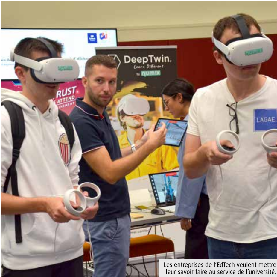
Les entreprises de l'EdTech veulent mettre leur savoir-faire au service de l'université.

Dotée d'un budget spécifique accordé par l'Etat, l'université de Poitiers veut développer l'usage des technologies immersives de formation. En interne, le PédagoLab accompagne les enseignants motivés.