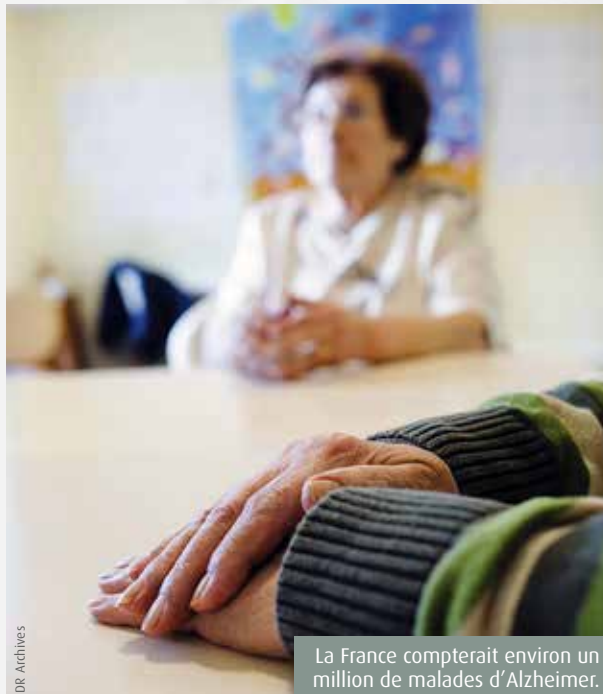
La France compterait environ un million de malades d'Alzheimer.

La Journée mondiale de la maladie d'Alzheimer, le 21 septembre,