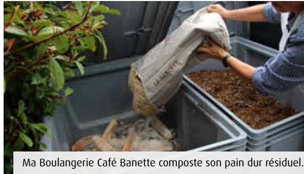
Ma Boulangerie Café Banette composte son pain dur résiduel.

Le compostage est devenu une nouvelle habitude pour les salariés de Ma Boulangerie Café Banette, sur la Technopole du Futuroscope. Chaque jour depuis deux mois, ils déposent dans des caisses le pain dur et les produits alimentaires en limite de consommation. Leurs collègues du Grand Large, à Poitiers, les confient à une structure qui oriente ce flux vers l'alimentation animale, entre autres mesures visant à réduire leur déchets. « Ça a été un peu long et fastidieux mais tout le monde s'y est mis », confie Jonathan