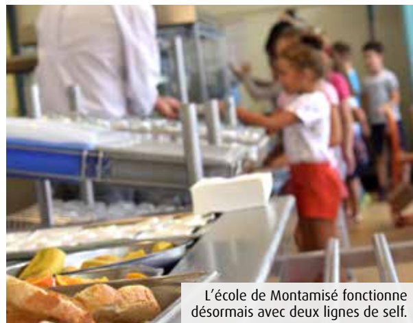
L'école de Montamisé fonctionne désormais avec deux lignes de self.

Testé et affiné l'an dernier, le dispositif a été pérennisé à la rentrée avec du matériel flambant neuf. Parallèlement, les flux ont été repensés et l'organisation optimisée pour