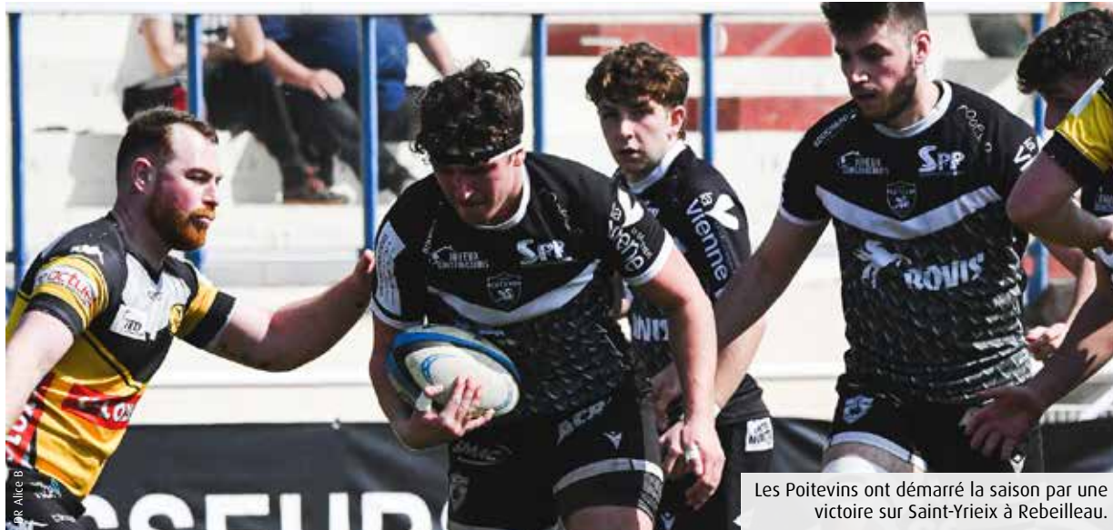
Les Poitevins ont démarré la saison par une victoire sur Saint-Yrieix à Rebeilleau.

Au sortir d'une découverte difficile de la Fédérale 2, les rugbymen du Stade poitevin espèrent lutter cette saison pour les premières places. Le nouveau président des Dragons, Olivier Farot, se veut ambitieux, sans griller les étapes.