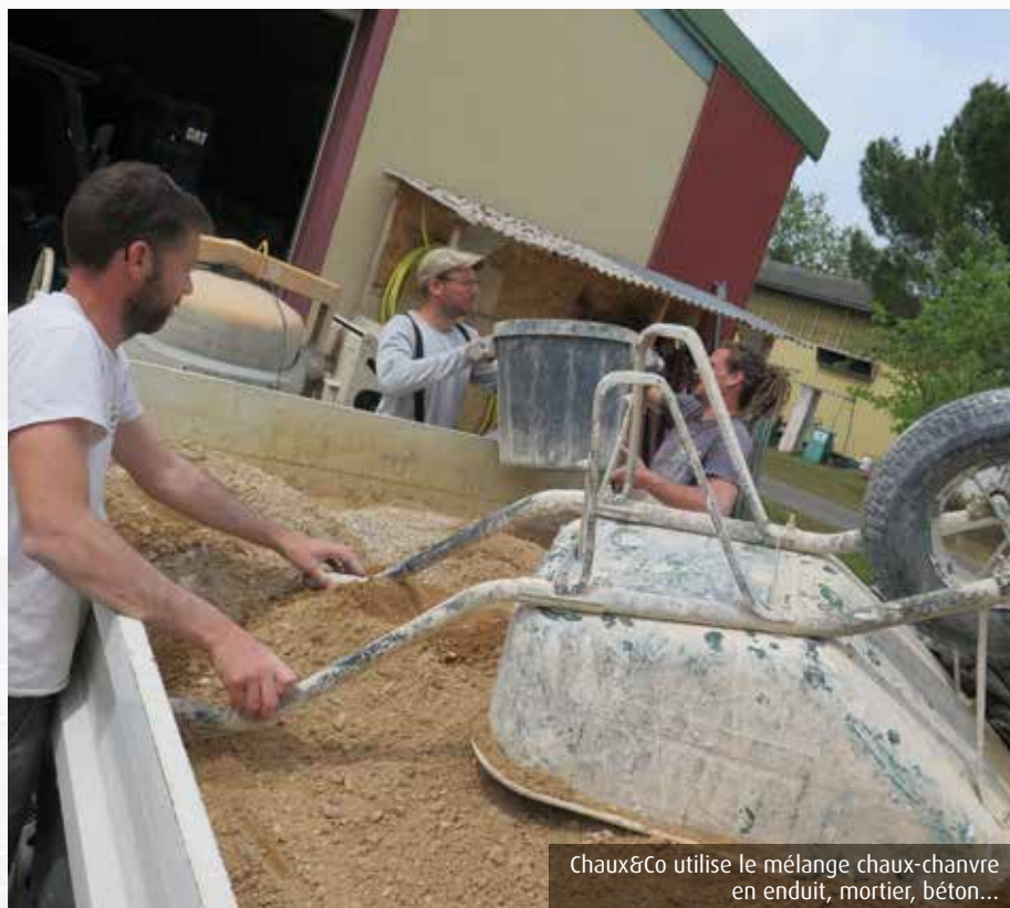
Chaux&Co utilise le mélange chaux-chanvre en enduit, mortier, béton...