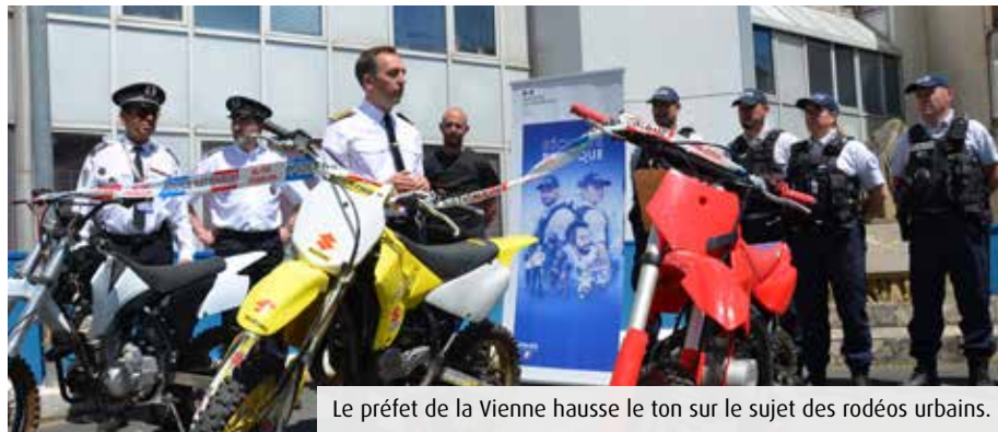
Le préfet de la Vienne hausse le ton sur le sujet des rodéos urbains.

À Bel Air, aux Couronneries de Poitiers, l'arrivée des beaux jours rime avec le retour des rodéos urbains. Des individus à moto ou en quad se mettent en scène au pied des immeubles en faisant vrombir le moteur de leur engin. Non seulement cette pratique met en danger le conducteur et les passants, mais elle perturbe considérablement la tranquillité des habitants qui n'en peuvent plus. Résultat, la police renforce sa présence sur le terrain. Trente-et-une opérations ont été réalisées ces der-