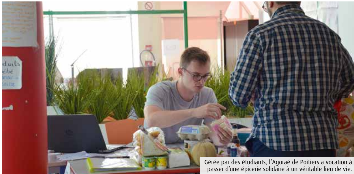
Gérée par des étudiants, l'Agoraé de Poitiers a vocation à passer d'une épicerie solidaire à un véritable lieu de vie.