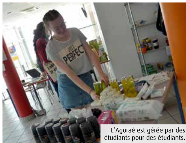
L'Agoraé est gérée par des étudiants pour des étudiants.