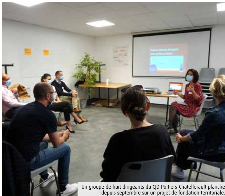
Un groupe de huit dirigeants du CJD Poitiers-Châtelleraut planche depuis septembre sur un projet de fondation territoriale.

C'est ainsi qu'il a posé sur la table du Centre des jeunes dirigeants (CJD) de Poitiers-Châtelleraut -dont il est le co-président- l'idée d'une fondation territoriale. Soit « mettre en mouvement tout un territoire autour du mécénat », en fédérant les moyens. Sept entrepreneurs l'ont rejoint en septembre dernier afin d'œuvrer à l'émergence d'une telle structure dans la Vienne. Accompagnant depuis plus de quarante ans des projets de mécénat collectif, l'Admical a su-