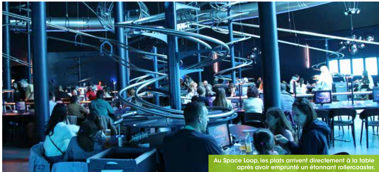
Au Space Loop, les plats arrivent directement à la table après avoir emprunté un étonnant rollercoaster.

Le 29 avril, le Futuroscope a ouvert un nouveau restaurant, accolé à l'hôtel Station Cosmos. Au Space Loop, les plats traversent la salle dans un grand huit avant d'atterrir sur la table. On a testé pour vous.