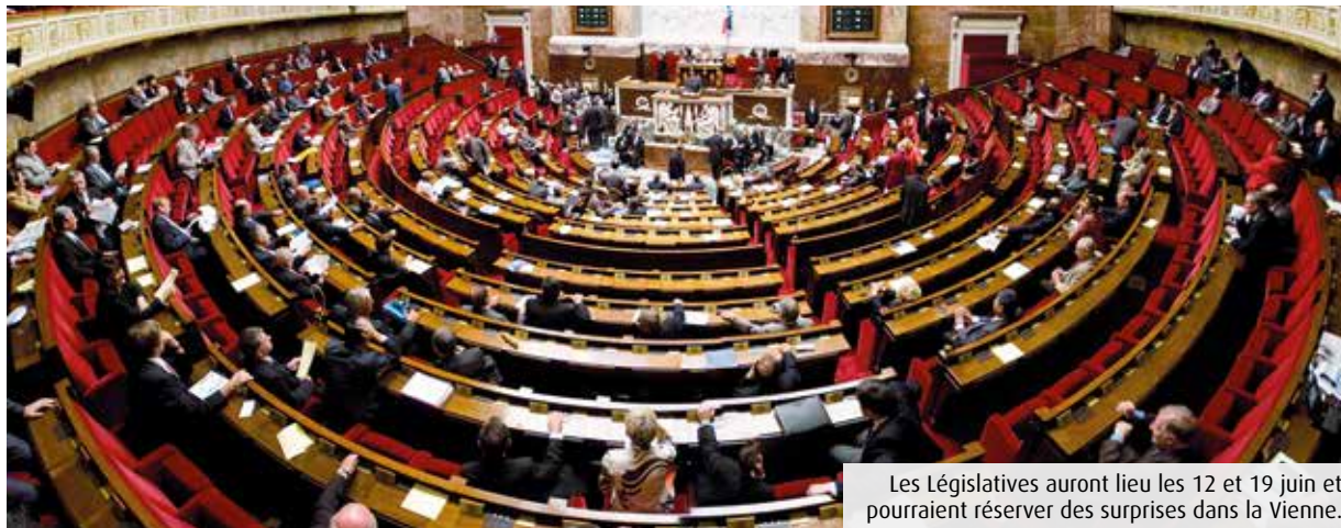
Les Législatives auront lieu les 12 et 19 juin et pourraient réserver des surprises dans la Vienne.

Des députés candidats à leur succession, la Nouvelle union populaire, écologiste et sociale ambitieuse, un Rassemblement national à l'affût... La bataille des Législatives des 12 et 19 juin a bel et bien démarré.