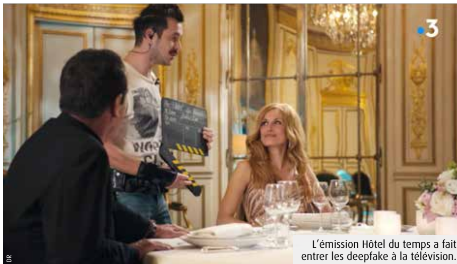
L'émission Hôtel du temps a fait entrer les deepfake à la télévision.

Ces vidéos peuvent paraître réelles, elles ne le sont pas. Même les voix sont synthétisées, quand elles ne sont pas produites par des imitateurs... L'objet de cet article n'est pas d'expliquer comment les deepfake sont fabriqués mais