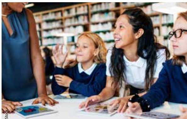
La place du numérique à l'école va se renforcer à la rentrée.

Neuf collèges, dont la liste est à retrouver sur le7.info ,