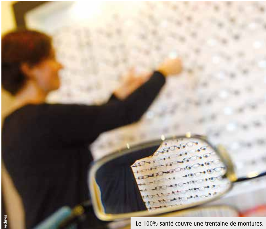
Le 100% santé couvre une trentaine de montures.

La pandémie de Covid-19 a eu pour effet -durable- d'éloigner les plus précaires des soins auxquels ils ont droit. Pour y remédier, l'Assurance maladie propose des simplifications et services d'accompagnement spécifiques. Piqûre de rappel.