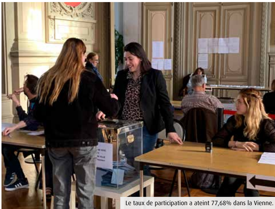
Le taux de participation a atteint 77,68% dans la Vienne.

A l'image des scores nationaux, la Vienne a placé Emmanuel Macron en tête (29,28%), devant Marine Le Pen (23,4%) et Jean-Luc Mélenchon (21,22%). Si le candidat insoumis finit cette fois-ci 3 e (2 e en 2017 avec 20,64%), il consolide son ancrage avec un nombre de voix équivalent. A Poitiers, il obtient carrément un plébiscite, terminant à 34,41%. De quoi laisser des regrets... « Aujourd'hui, 20% (21,95, ndr) des électeurs se sont saisis d'un bulletin de vote Jean-Luc Mélenchon, nous devons être à la