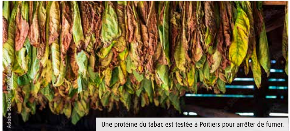
Une protéine du tabac est testée à Poitiers pour arrêter de fumer.

Le CHU cherche des volontaires ! Plus précisément, le centre d'investigation clinique (CIC) labellisé Inserm à Poitiers s'apprête à lancer une étude pour évaluer un traitement innovant d'aide au sevrage tabagique. Le laboratoire privé NFL Biosciences a mis au point une molécule contenant une protéine extraite des feuilles de tabac elles-mêmes. L'idée consiste en quelque sorte à combattre le mal par le mal... Cette fameuse protéine était déjà connue des scientifiques pour lutter