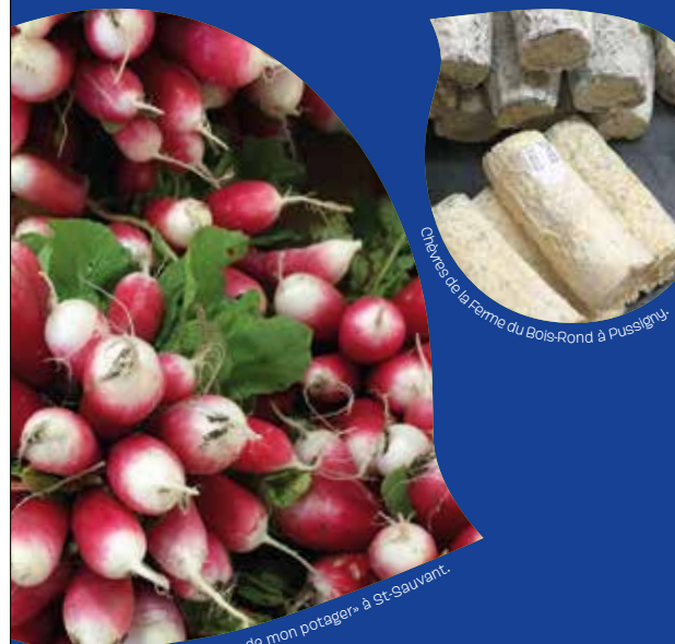
Radis de chez «Les Légumes de mon potager» à St-Sauvant. Cherries de la ferme du Bois-Rond à Pussigny.

CHEZ BIOCOOP LES PRODUITS LOCAUX SONT PARTOUT