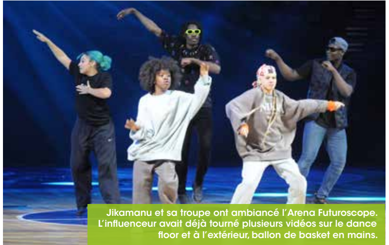
Jikamanu et sa troupe ont ambiancé l'Arena Futuroscope. L'influenceur avait déjà tourné plusieurs vidéos sur le dance floor et à l'extérieur, ballon de basket en mains.