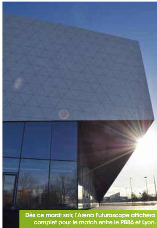
Dès ce mardi soir, l'Arena Futuroscope affichera complet pour le match entre le PB86 et Lyon.