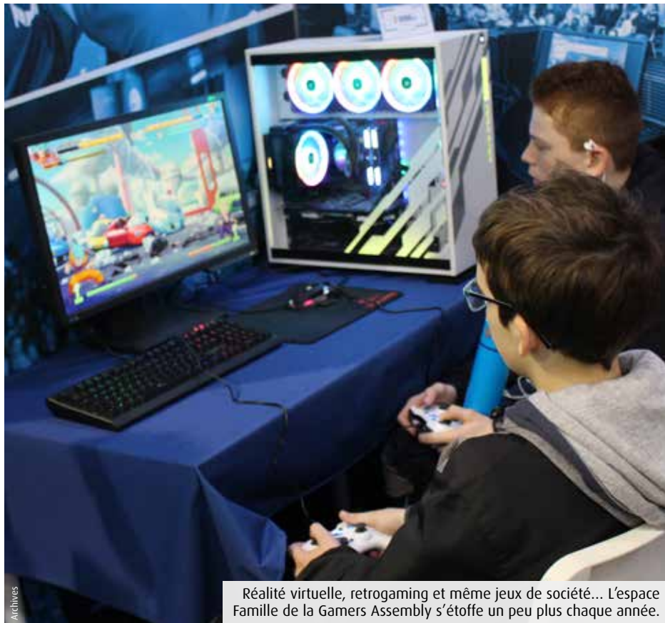
Réalité virtuelle, retrogaming et même jeux de société... L'espace Famille de la Gamers Assembly s'étoffe un peu plus chaque année.

Après deux dernières éditions « online », la Gamers Assembly revient à son format traditionnel, avec un festival « physique » au Parc des expositions de Poitiers. Et un espace Famille toujours plus dense, qui célèbre le jeu au sens large.