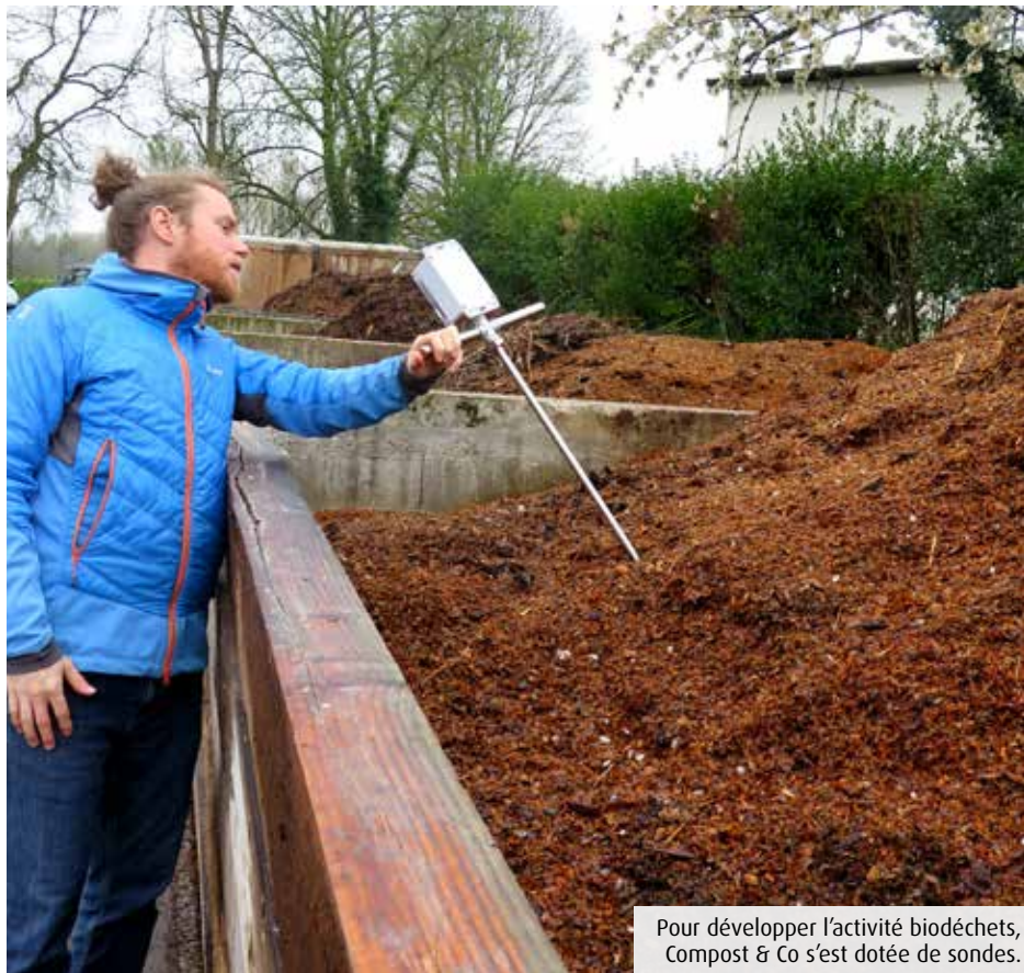
Pour développer l'activité biodéchets, Compost & Co s'est dotée de sondes.

A partir de 2024, le tri à la source des biodéchets sera obligatoire. Déjà positionnée sur les toilettes sèches, l'entreprise Toilettes & Co, basée à Saint-Georges-les-Bailargeaux, se diversifie sous la marque Compost & Co.