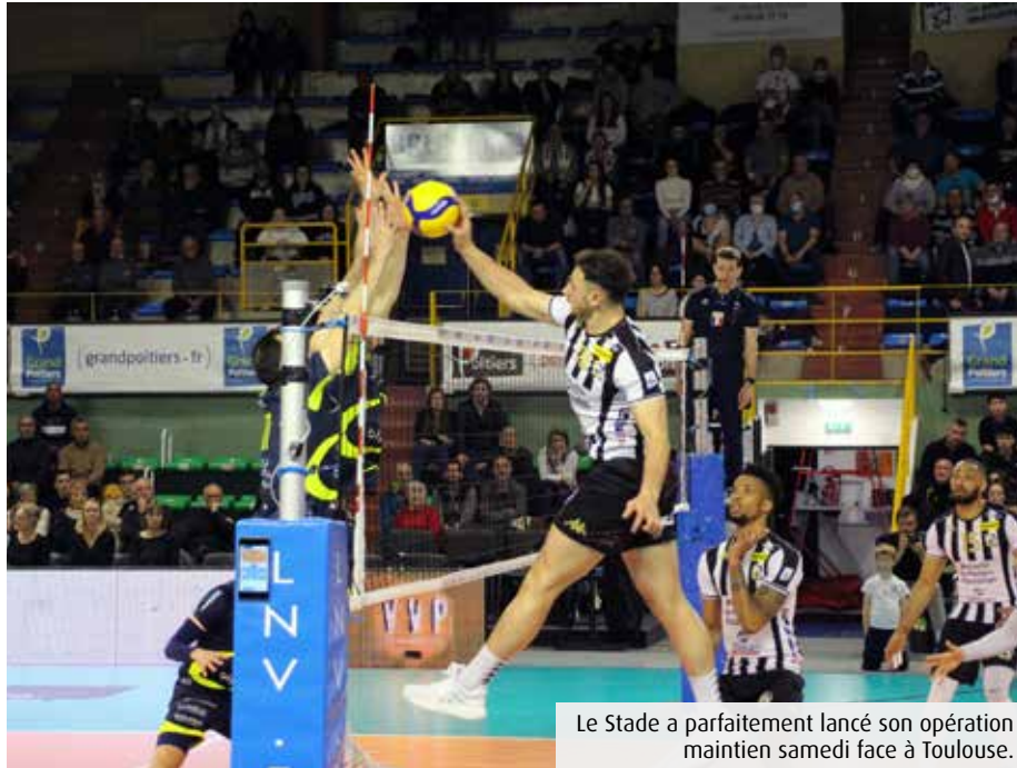
Le Stade a parfaitement lancé son opération maintien samedi face à Toulouse.

« On vient de loin depuis le début de l'année, souffle le coach poitevin. Cela fait deux mois qu'on arrive à être plus calme, plus serein dans les moments chauds. » Le SPVB récolte les fruits d'un travail mental opéré depuis plusieurs semaines, au gré de mises en situation ludiques « pour garder le cap, même quand c'est dur ». Mais aussi d'automatismes qui se dessinent enfin dans cet effectif considérablement remanié à l'intersaison (Le7