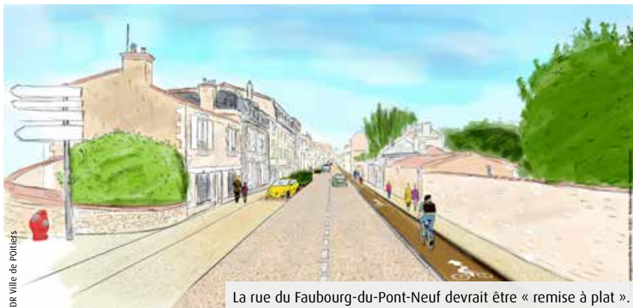
La rue du Faubourg-du-Pont-Neuf devrait être « remise à plat ».

La Ville de Poitiers a surpris son monde, la semaine dernière, en annonçant l'abandon de son projet de voie à sens unique dans la rue du Faubourg-du-Pont-Neuf. Au moment de présenter les résultats de l'expérimentation réalisée entre septembre et octobre 2021 sur cet axe (lire Le 7 n°531), la maire Léonore Moncond'huy a justifié cette décision par les « désagréments extrêmement importants » qui sont apparus lors de cette phase de test. Outre les reports de circulation sur d'autres axes proches, le non-respect du sens interdit a définitivement enterré la solution d'un