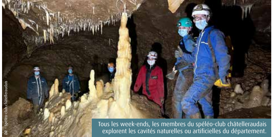
DR - Spéléo-club châtelleraudais

Depuis le début de la pandémie, le club organise une sortie tous les week-ends et l'adapte