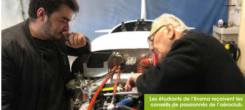
Les étudiants de l'Ensm reçoivent les conseils de passionnés de l'aéroclub.