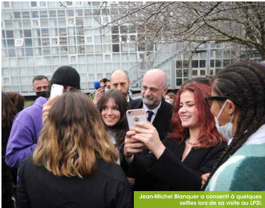
Jean-Michel Blanquer a consenti à quelques selfies lors de sa visite au LP2i.

Une Semaine internationale La semaine dernière, à l'occasion d'une énième visite dans la « capitale de l'Éducation nationale », Jean-Michel Blanquer a eu un aperçu de la dimension internationale du LP2i... notamment par ses