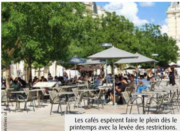
Les cafés espèrent faire le plein dès le printemps avec la levée des restrictions.

40 000. C'est le nombre de cafés, d'hôtels et de restaurants qui seraient « en grand danger dans les deux ans à venir », sur les 220 000 que compte le pays. Le chiffre, révélé la semaine dernière, à Poitiers, par Roland Héguay ne laisse d'inquiéter. Le président national de l'Union des métiers et des industries de l'hôtellerie (Umih) se dit notamment contrarié par plusieurs phénomènes : le remboursement des Prêts garantis par l'Etat et la nécessité d'investir en même temps, l'augmentation du coût des matières premières, de