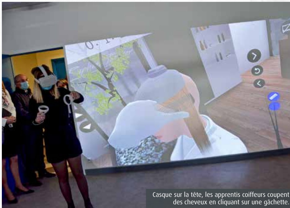
Casque sur la tête, les apprentis coiffeurs coupent des cheveux en cliquant sur une gâchette.

Spon-tanément, proposer des cours de coiffure en réalité virtuelle pourrait sembler incongru. Et pourtant, les apprentis coiffeurs du Campus des métiers ont compris l'intérêt du dispositif. Casque sur la tête, une jeune femme tient un peigne virtuel dans une main et appuie sur une gâchette avec l'autre pour simuler des coups de ciseaux. Très vite, ses repères dans l'espace sont plus assurés, ses gestes deviennent plus précis. « Cet outil permet d'apprendre le protocole de coupe, dans quel ordre on fait les choses,