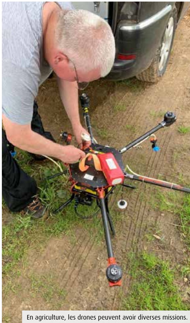
En agriculture, les drones peuvent avoir diverses missions.