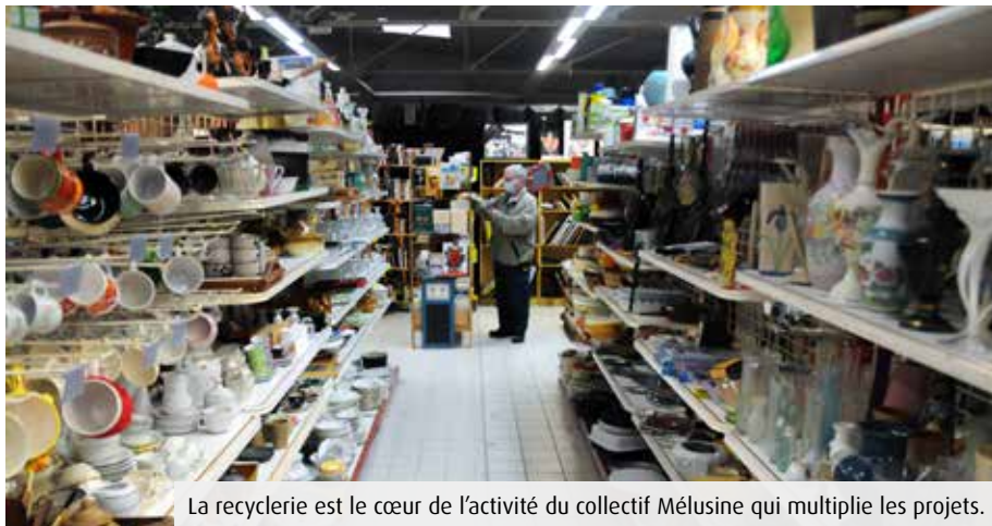
La recyclerie est le cœur de l'activité du collectif Mélusine qui multiplie les projets.

Les anciens Intermarché et Leader Price de Lusignan a des airs de caverne d'Ali Baba. Rien qu'en 2021, le collectif Mélusine a collecté 70 tonnes de matériels informatiques, jouets, vêtements, vaisselle... que ses bénévoles trient et réparent, inlassablement, avant de les remettre en vente dans une logique circulaire. Derrière cette activité visible, qui attire plusieurs centaines de clients chaque année, le tiers-lieu héberge un nombre incalculable d'activités aux ressorts solidaires. Ne serait-ce qu'en pleine tempête sanitaire, le collectif et son réseau citoyen ont fabriqué « 12 000 masques et 15 000 visières dis-