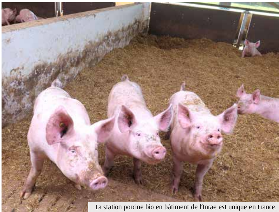
La station porcine bio en bâtiment de l'Inrae est unique en France.

Le saviez-vous ? La Vienne Labrite à Rouillé le seul site d'élevage de porcs bio en bâtiment. Cette unité de l'Inrae (Institut national de recherche pour l'agriculture, l'alimentation et l'environnement), baptisée Porganic, a été spécialement conçue dans le respect du bien-être animal. De la paille fraîche, de la lumière naturelle, des dômes chauffés et des zones d'exercice sous forme de courettes... Même l'odeur n'y est pas ! La station, qui rassemble 48 truies reproductrices Large White et jusqu'à 480 porcelets, doit servir à faire progresser l'élevage porcin bio, évaluer ce qui fonctionne ou pas et expérimenter des solutions. Sur le site rullois, à quelques mètres des bâtiments construits conformément au cahier des charges bio, une station « en conventionnel », reconnaissable à ses caillebotis en ciment, offre la comparaison. « Cette mixité bio/non bio n'est possible que dans le cadre expérimental. C'est ce qui fait la richesse de notre dispositif », explique Stéphane Ferchaud,