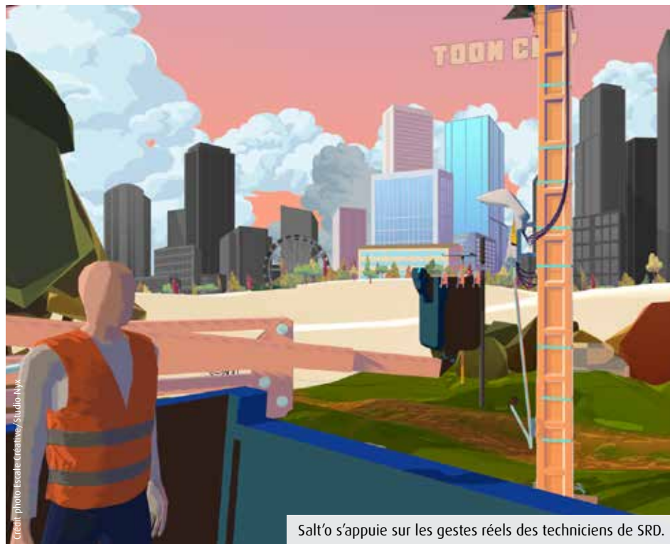
Salt'o s'appuie sur les gestes réels des techniciens de SRD.

Le gestionnaire de réseaux d'électricité SRD a collaboré avec l'agence poitevine Escala créative, spécialisée dans l'innovation pédagogique. Les deux partenaires ont mis au point un jeu immersif dans le but de susciter des vocations dans les métiers techniques.