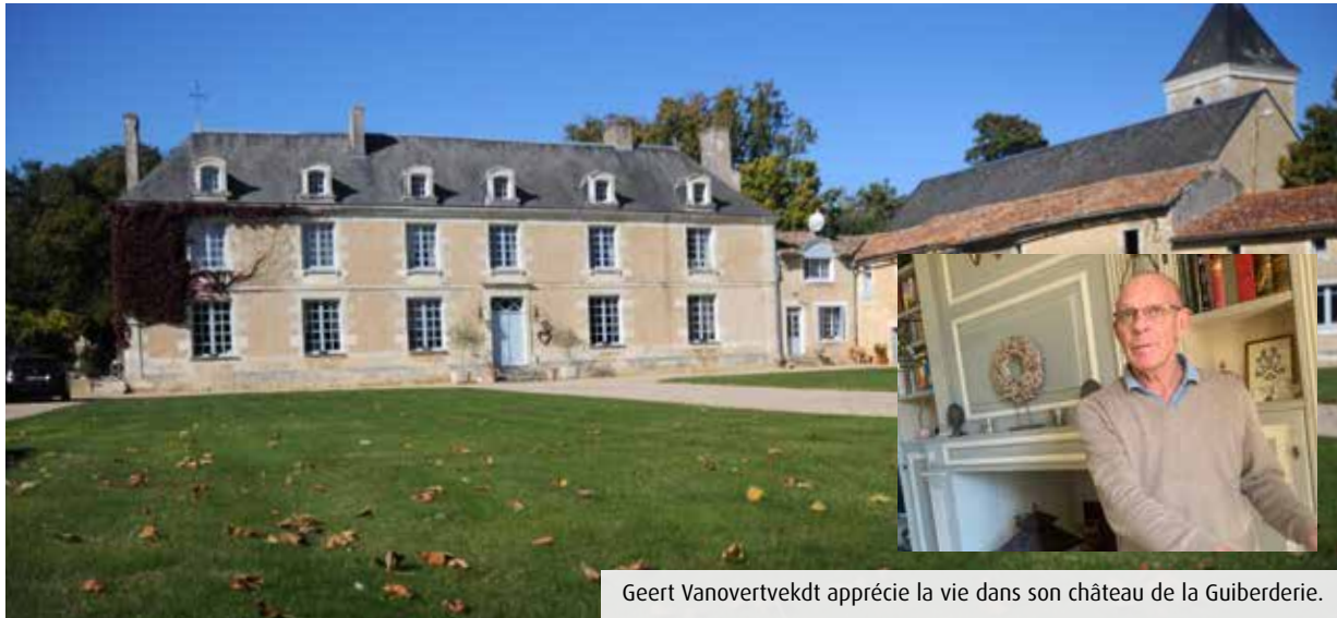
Geert Vanovertekdtd apprécie la vie dans son château de la Guiberderie.

La vie de château, c'est aussi un labeur de tous les jours. Chaque matin, Geert nourrit et soigne ses animaux, des équidés donc, mais aussi un émeu, des poules... Au-delà, il a passé beaucoup de temps à rénover l'intérieur et tondre les parcelles engazonnées. Il y a trois ans, le châtelain s'est même attaqué à la taille des trente platanes de l'allée centrale. « On a passé six jours avec des amis en plein mois d'août, de 8h à 20h, sous une chaleur accablante. Mes voisins m'ont dit Vous les Belges, vous êtes fous ! » La médaille a son revers. Il y a quelques années, Geert a chuté de quatre mètres sur du béton. Résultat : des côtes cassées, des vertèbres tassées et quelques mois de rééducation !