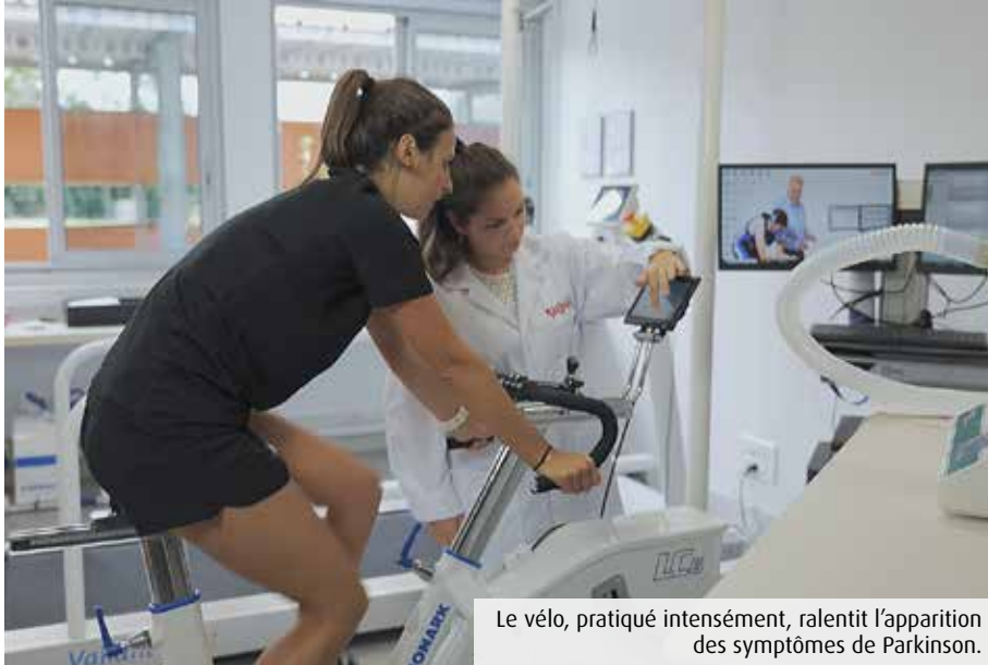
Le vélo, pratiqué intensément, ralentit l'apparition des symptômes de Parkinson.