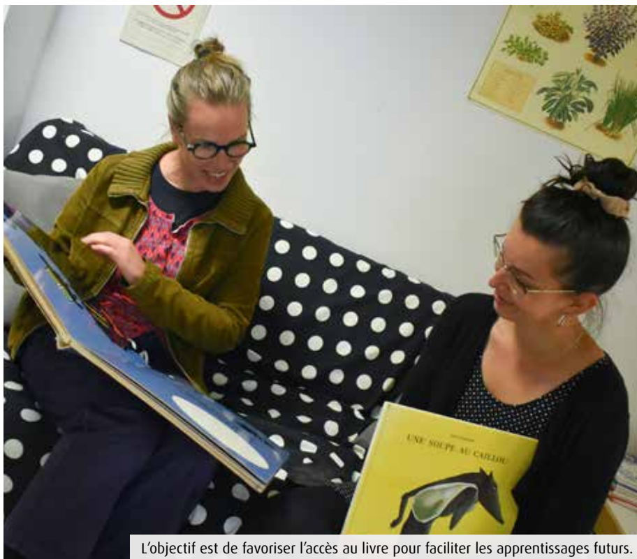
L'objectif est de favoriser l'accès au livre pour faciliter les apprentissages futurs.

L'expérimentation cible tout particulièrement les quartiers prioritaires de Poitiers, Beaulieu, Saint-Eloi, Bel-Air, les Couronneries, les Trois-Cités ainsi que Bellejouane. Initiée aux Couronneries, elle va progressivement être étendue aux autres secteurs, le temps de recruter des étudiants, 200 cette