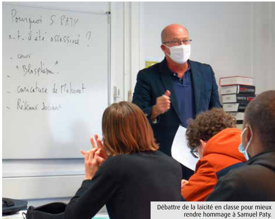
Débattre de la laïcité en classe pour mieux rendre hommage à Samuel Paty.

Elle a hésité à témoigner. Non pas qu'elle n'y voit pas intérêt, mais « juste le fait de reparler de l'événement me perturbe encore », confie-t-elle. Finalement, elle a accepté parce qu'elle a « foi en son métier ». Le 16 octobre 2020, Samuel Paty, professeur d'histoire-géographie, a été assassiné à la suite d'un cours sur la liberté d'expression. Un an plus tard, cette collègue d'un collège du Sud-Vienne confie « être encore plus prudente aujourd'hui sur le choix des exemples et du vocabulaire utilisés ». Elle veut être certaine que le message passe. « Avant, on savait qu'il pouvait être partiellement entendu, aujourd'hui on a la crainte que les élèves n'en prennent qu'une partie. Depuis dix ans que j'enseigne, j'ai changé de discours sur la démocratie. Avant, elle n'était pas autant menacée. » Toutes les occasions sont bonnes pour aborder les valeurs de la République. « Par exemple, en 4 e , en octobre, on parle de la philosophie des Lumières. Ce chapitre a pris une importance fondamentale, avec des textes comme la Prière à Dieu de Voltaire où il écrit : « Tu ne nous as point donné des mains pour nous égarer »... »