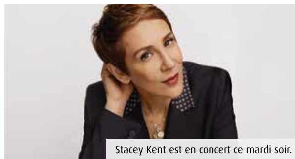
Stacey Kent est en concert ce mardi soir.