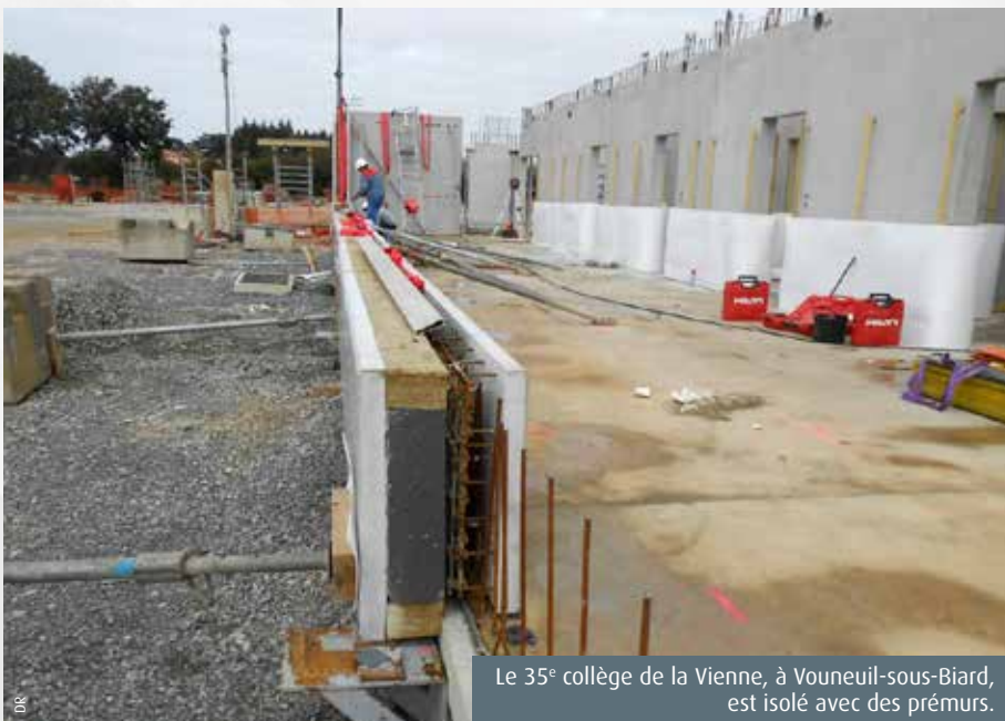
Le 35 e collège de la Vienne, à Vouneuil-sous-Biard, est isolé avec des prémurs.

« Lors du dépôt de permis du 35 e collège, en 2018, nous étions soumis à la RT2012. Pour aller au-delà, nous avons décidé de répondre au label E+C- (ndlr, bâtiment à énergie positive et réduction carbone), explique Franck Fauquembergue, directeur de l'Éducation et des Bâtiments au Département. D'où le choix d'un rez-de-chaussée en béton -nous sommes en zone de sismicité 3-, des élé-