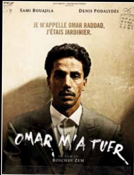
Drame de Roschdy Zem (1h24), avec Sami Bouajila, Denis Podalydès, Maurice Bénichou. A l'affiche au CGR Castille.