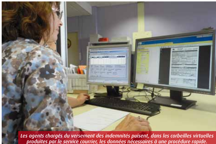
Les agents chargés du versement des indemnités puisent, dans les corbeilles virtuelles produites par le service courrier, les données nécessaires à une procédure rapide.

Un crève-cœur pour l'Assurance maladie, qui a fait sa priorité de « la non-rupture entre le versement du salaire de ses administrés et celui des indemnités journalières pendant l'arrêt de travail. » Dans les sous-sols de la CPAM de la Vienne, une quinzaine d'agents du service courrier et archivage s'active, depuis plu-