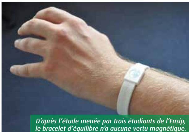
D'après l'étude menée par trois étudiants de l'Ensip, le bracelet d'équilibre n'a aucune vertu magnétique.

■ Antoine decourt adecourt@7apoitiers.fr