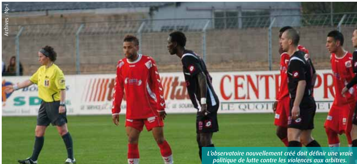
Archives : Np-1

■ Antoine decourt adecourt@7apoitiers.fr