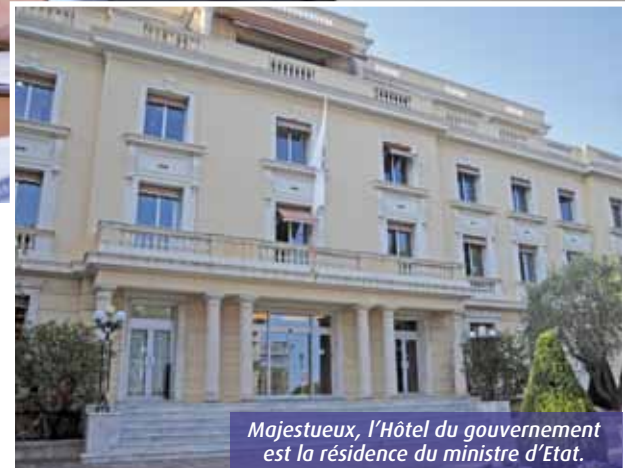
Majestueux, l'Hôtel du gouvernement est la résidence du ministre d'Etat.

Les journées d'un ministre d'Etat sont interminables et le rythme soutenu. « Je commence vers 8h et je termine rarement avant minuit. En plus des réunions, des rendez-vous, des audiences et des dossiers à traiter, j'ai un rôle important de représentation à jouer. Et il se passe toujours quelque