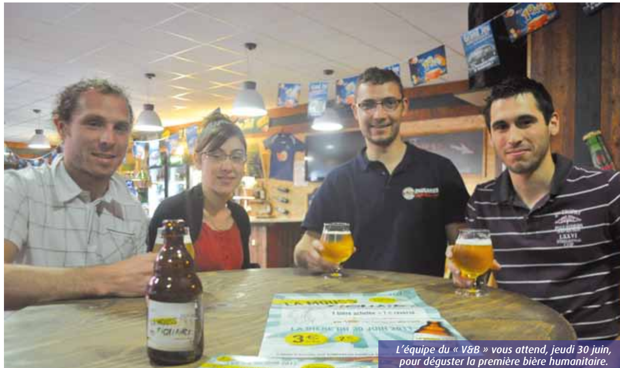
L'équipe du « V&B » vous attend, jeudi 30 juin, pour déguster la première bière humanitaire.

Une soirée caritative au profit de la lutte contre la malaria sera organisée, le jeudi 30 juin, au bar « V&B » à Poitiers. A cette occasion, vous pourrez déguster « La Mouss'tiquaire », une bière spécialement créée pour l'opération.