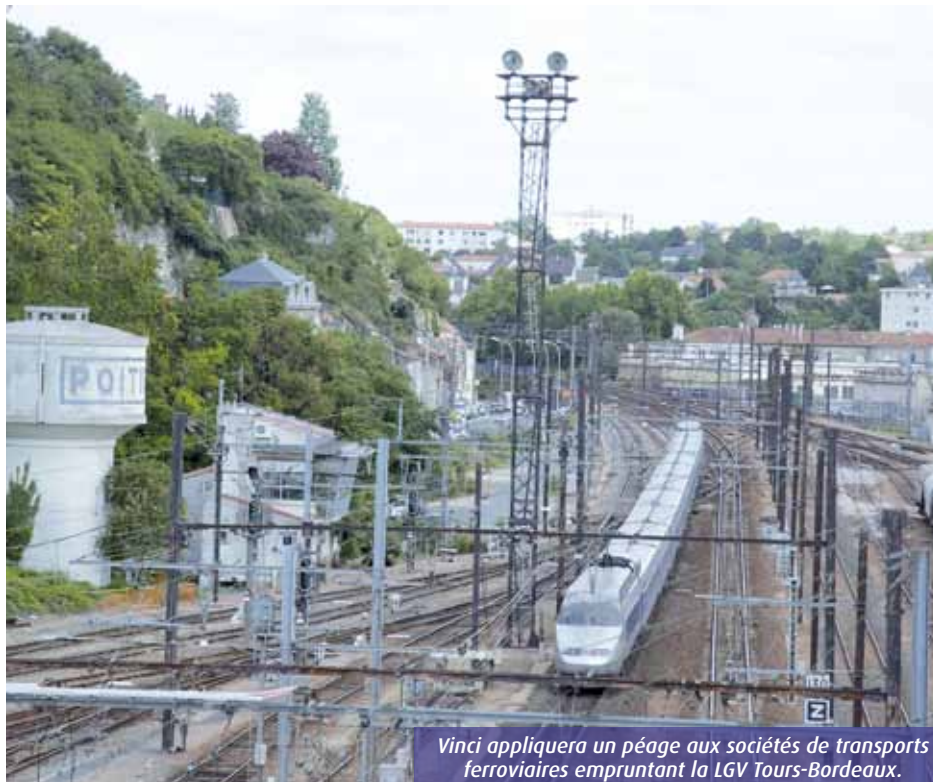
Vinci appliquera un péage aux sociétés de transports ferroviaires empruntant la LGV Tours-Bordeaux.

L'Union européenne, l'Etat et les collectivités (hors Région Poitou-Charentes, conseil général des Deux-Sèvres,...) apportent 3 milliards d'euros (3MM€). Réseau ferré de France met également un 1MM€ au pot. Le solde est versé par Vinci et ses partenaires bancaires, soit 3,8MM€. A noter que la Caisse des dépôts va octroyer un prêt de 757M€ à Vinci en utilisant les fonds du Livret A. Le montant total des travaux s'élève donc à 7,8MM€.