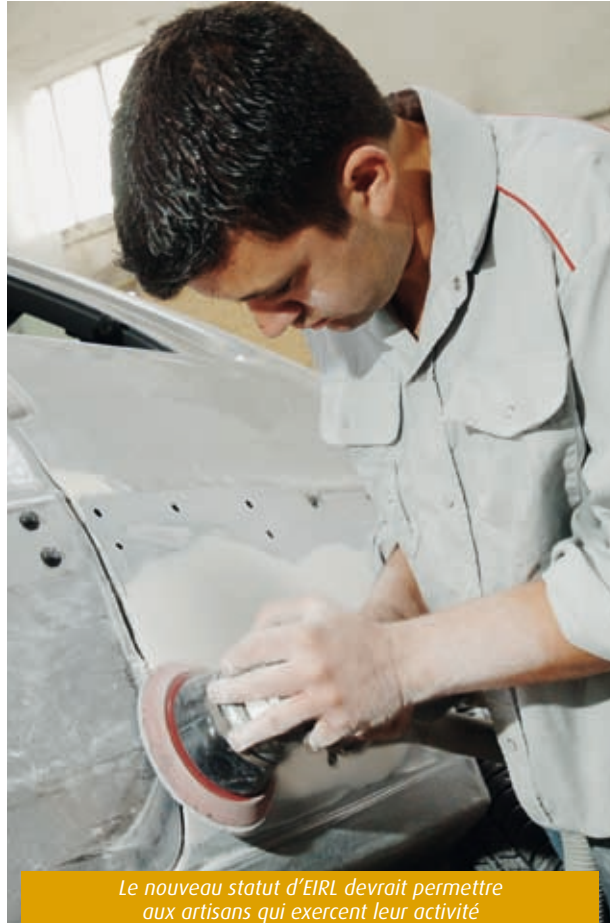
Le nouveau statut d'EIRL devrait permettre aux artisans qui exercent leur activité en nom propre de limiter leur risques personnels.

"Ce nouveau statut a pour ambition majeure de limiter les risques personnels pour les artisans qui exercent leur activité en nom propre. Jusqu'à présent, le créateur seul avait, comme solution pour restreindre les risques encourus, de créer une société unipersonnelle à responsabilité limitée (EURL). Alors que l'entrepreneur individuel est responsable des dettes générées par son activité professionnelle sur la totalité de son patrimoine, l'unique associé d'une EURL, quant à lui, n'est responsable que dans la limite du montant de ses apports. Le projet de loi sur l'EIRL prévoit entre autres la possibilité pour l'artisan de séparer son patrimoine gé-