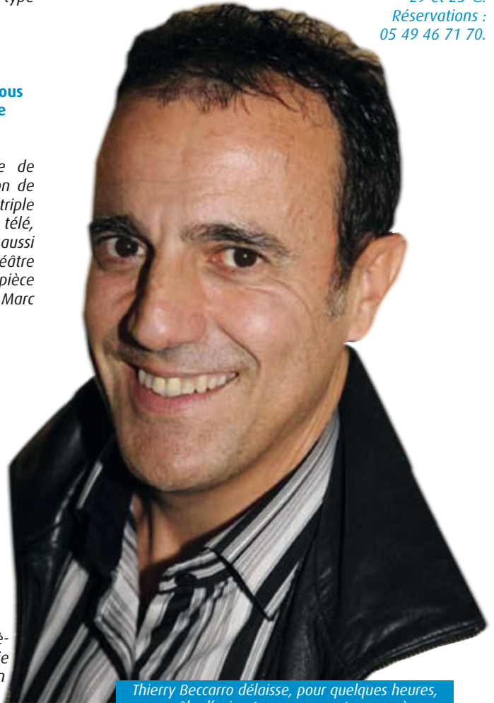
Thierry Beccaro délaisse, pour quelques heures, son rôle d'animateur pour monter sur scène.

Dimanche 24 janvier à 15h au centre Multimédia de Jaunay-Clan. 29 et 25 €. Réervations : 05 49 46 71 70.