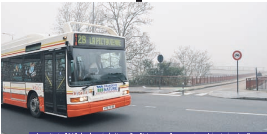
A partir de 2013, les bus de la ligne "La Pictavienne" emprunteront le viaduc des Rocs.

■ Christophe Mineau cmineau@7apoitiers.fr