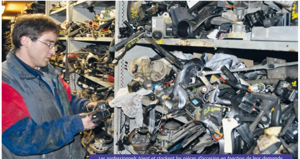
Les professionnels trient et stockent les pièces d'occasion en fonction de leur demande.

Au-delà, l'aménagement progressif du futur hôtel pourra prendre le relais.