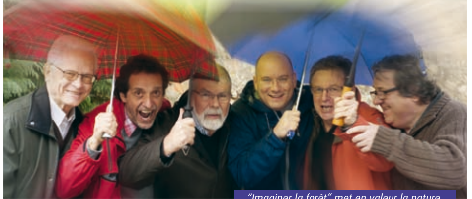
"Imaginer la forêt" met en valeur la nature.

■ Christophe Mineau cmineau@7apoitiers.fr