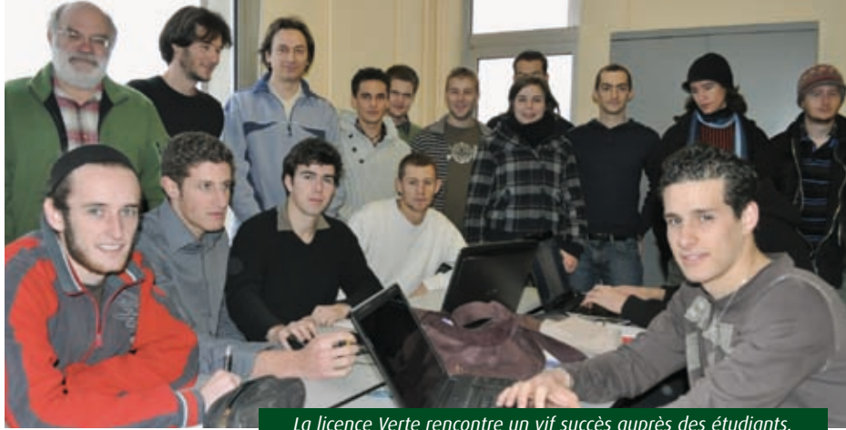
La licence Verte rencontre un vif succès auprès des étudiants.

Les temps changent et les formations universitaires doivent s'adapter aux nouvelles exigences en matière de développement durable. Rien d'anormal donc à ce que le département de Génie Thermique et Energie de l'Université de Poitiers ait créé une licence professionnelle dite "verte" dont la vocation est de former des étudiants dans le secteur des énergies renouvelables, mais aussi de promouvoir une utilisation rationnelle et maîtrisée de l'énergie. "La notion