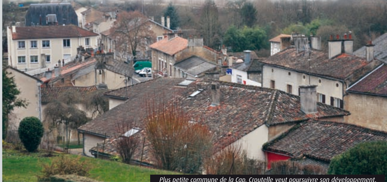
Plus petite commune de la Cap, Croutelle veut poursuivre son développement.

A l'étroit sur un minuscule territoire de 1,5 km 2 , la commune de Croutelle tente de conserver son autonomie alors que ses marges de manœuvre sont quasi inexistantes.