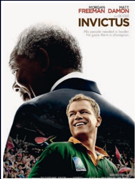
"Invictus". Film de Clint Eastwood, avec Morgan Freeman, Matt Damon, Scott Eastwood. 2h12. Projeté au CGR Castille et MEGA CGR de Buxerolles.