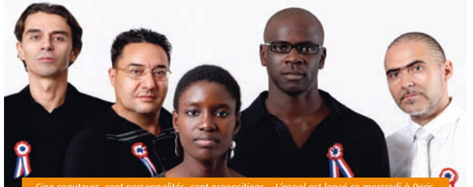
Cinq coauteurs, cent personnalités, cent propositions... L'appel est lancé ce mercredi à Paris.

suivi des 100 propositions pluricitoyennes