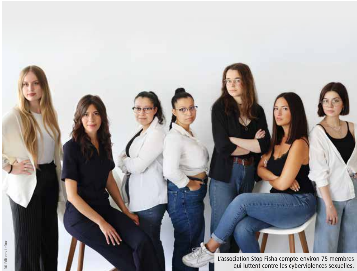
L'association Stop Fisha compte environ 75 membres qui luttent contre les cyberviolences sexuelles.