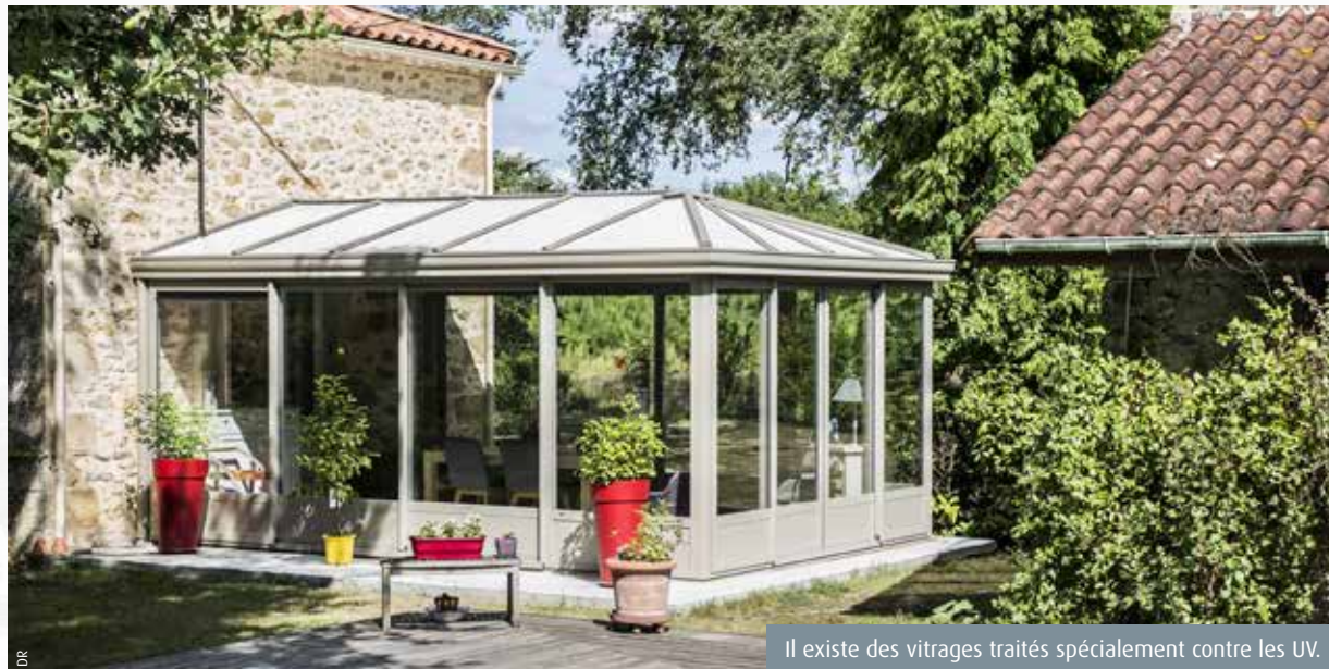
Il existe des vitrages traités spécialement contre les UV.

Trois taux de TVA sont applicables pour une véranda, 20, 10 ou 5%. Le pourcentage varie en fonction des caractéristiques de la véranda ou du logement, ainsi que de la façon dont vont être réalisés les travaux. Le taux de 20% s'applique pour un logement neuf construit depuis moins de cinq ans et quand la véranda agrandit la surface de plancher de l'habitation de plus de 10%. La TVA à 10% concerne les travaux d'aménagement, d'amélioration et de transformation du logement. Enfin, le taux à 5% est accessible en cas de travaux d'amélioration des performances énergétiques.