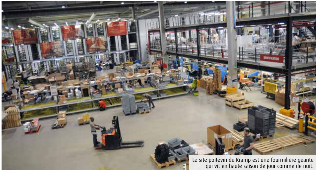
Le site poitevin de Kramp est une fourmière géante qui vit en haute saison de jour comme de nuit.

Dix ans après son implantation à Poitiers, le spécialiste de la vente de pièces détachées pour l'agriculture, la motoculture et les travaux publics réalise de nouveaux travaux d'agrandissement. Objectif affiché : doubler le nombre de commandes. Le site emploie 300 salariés.