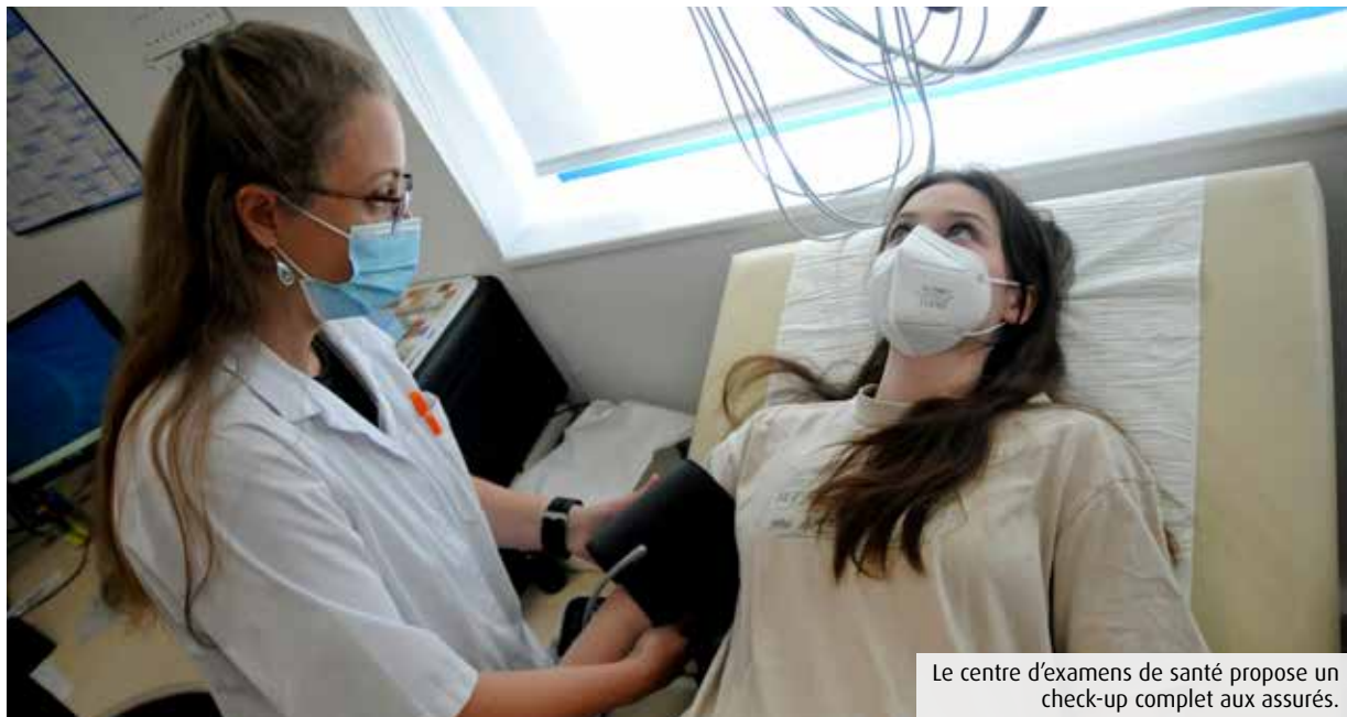
Le centre d'examens de santé propose un check-up complet aux assurés.

Situé à Saint-Eloi, le Centre d'examens de santé de la Caisse primaire d'assurance maladie (CPAM) de la Vienne s'efforce désormais d'aller au-delà de la prévention, en proposant des ateliers thérapeutiques ou en orientant les assurés vers d'autres spécialistes.