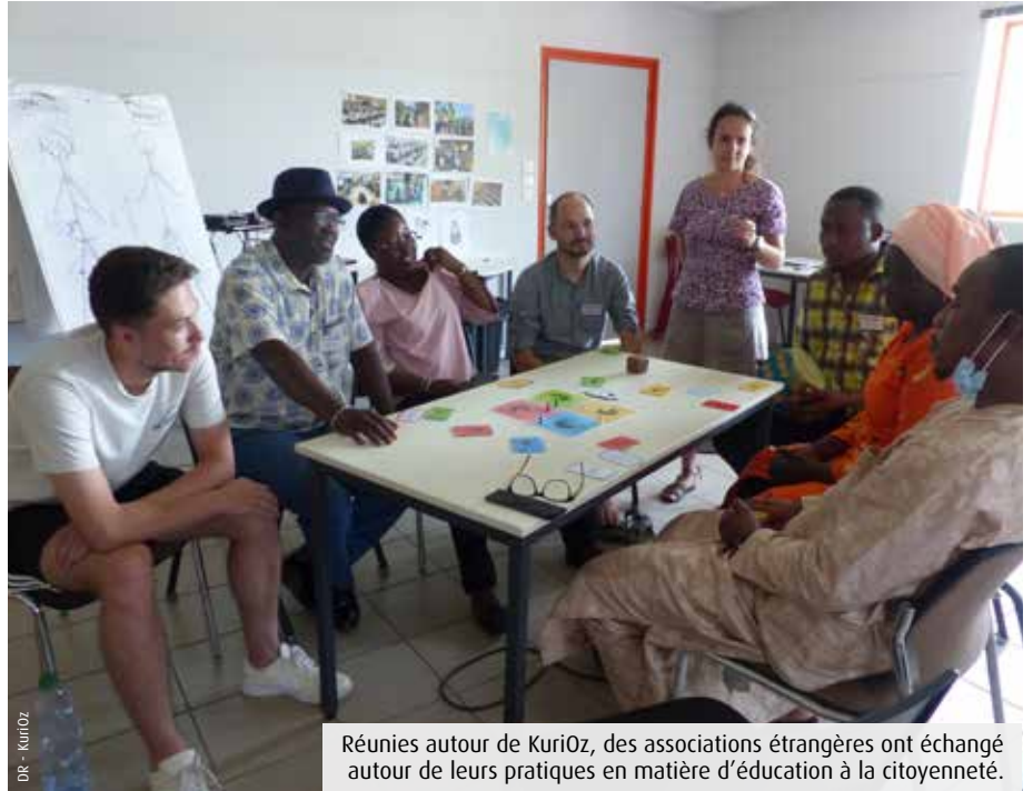
Réunies autour de KuriOz, des associations étrangères ont échangé autour de leurs pratiques en matière d'éducation à la citoyenneté.