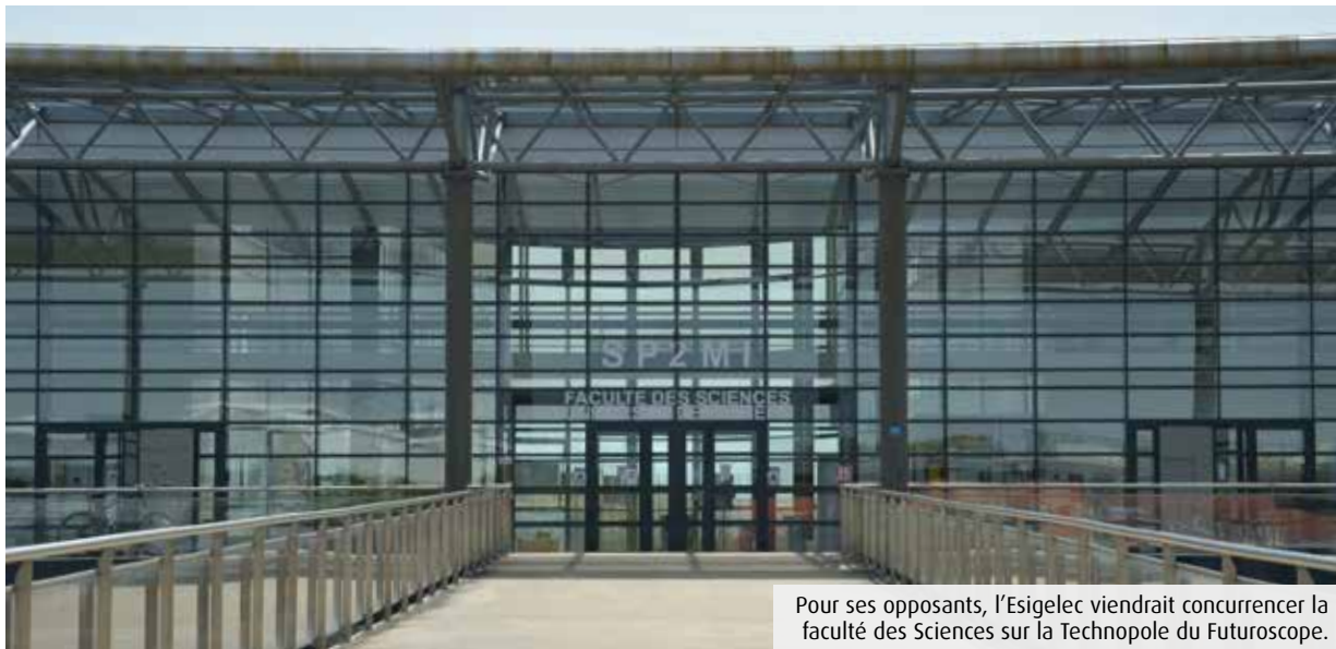
Pour ses opposants, l'Esigelec viendrait concurrencer la faculté des Sciences sur la Technopole du Futuroscope.