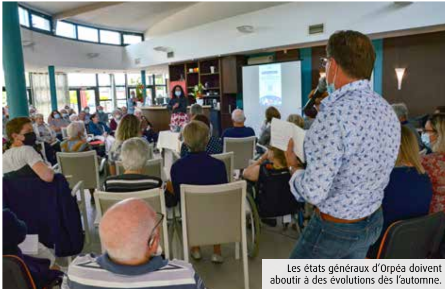
Les états généraux d'Orpéa doivent aboutir à des évolutions dès l'automne.