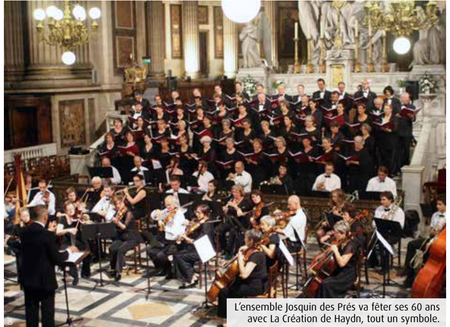
L'ensemble Josquin des Prés va fêter ses 60 ans avec La Création de Haydn, tout un symbole.