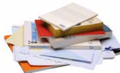
Tous les autres papiers.