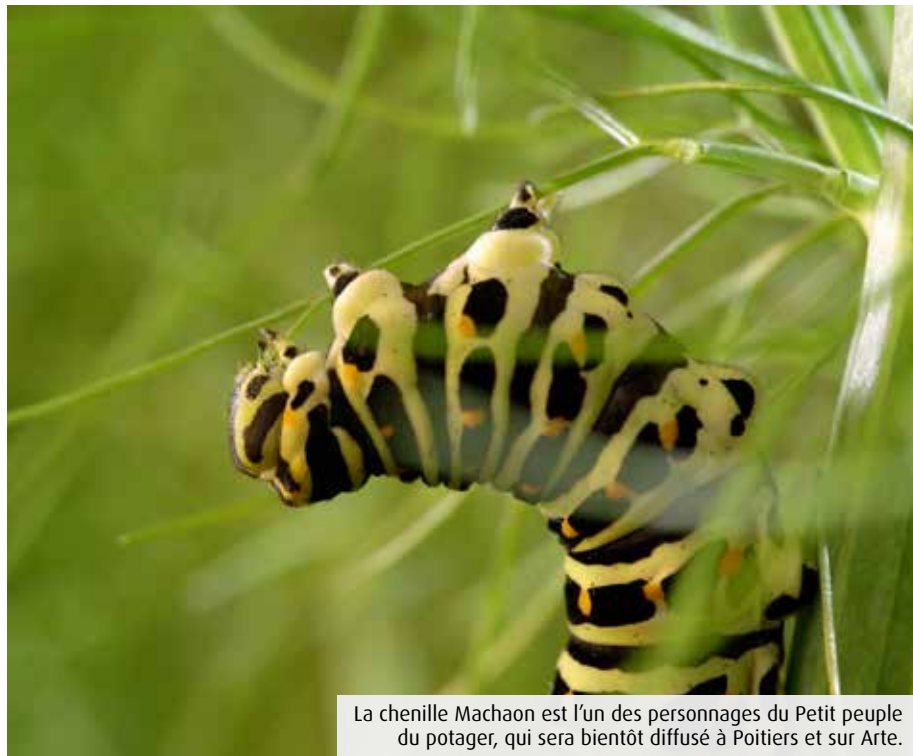
La chenille Machaon est l'un des personnages du Petit peuple du potager, qui sera bientôt diffusé à Poitiers et sur Arte.

Les insectes cohabitent avec nous, discrètement, à même nos jardins. Et pourtant, nous ne connaissons que trop peu toutes ces vies minuscules qui grouillent par milliers sous nos pieds. C'est après avoir découvert leur rôle dans l'équilibre d'un potager, des premières pousses à la récolte, que Guilaine Bergeret et Rémi Rappe ont souhaité leur consacrer un documentaire. « On a voulu montrer leur capacité à répondre à un problème naturel, confie la co-réalisatrice. Cette harmonie des insectes avec les plantes nous a fascinés. » Issu d'une collaboration franco-allemande, notamment avec la boîte poitevine Grenouilles Productions, Le Petit Peuple du Potager conte les histoires de différentes espèces, selon le cycle des plantes. Saviez-vous par exemple que la reine bourdon, indispensable à la pollinisation, pouvait pondre à elle seule une colonie de soixante ouvrières ? Ou encore que la femelle perce-oreille était très utile pour « nettoyer » les légumes des pucerons, en plus d'avoir un instinct maternel développé ? « La biodiversité que l'on montre est celle de chez