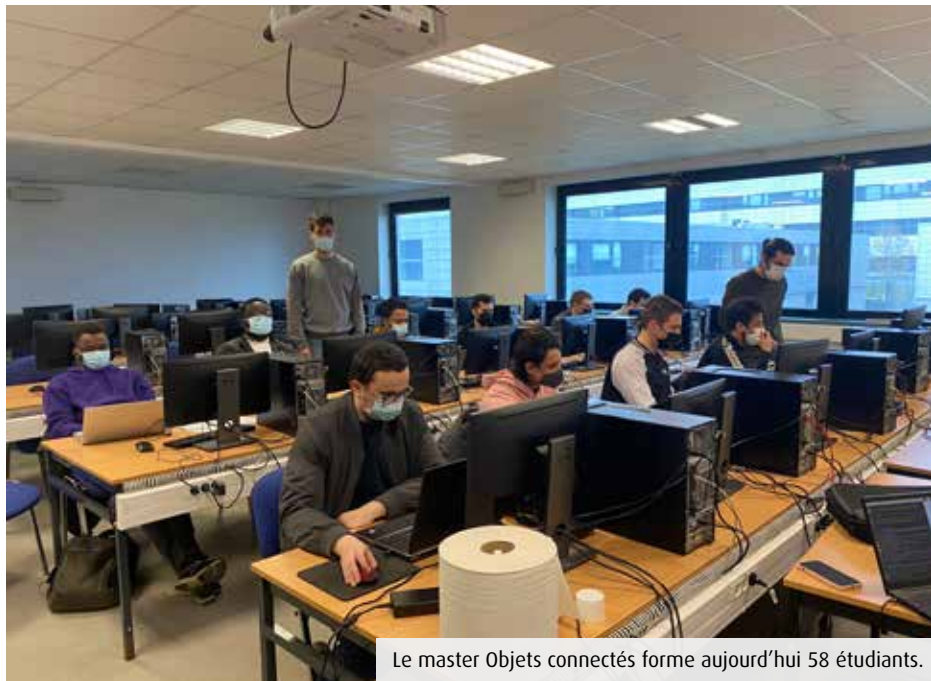
Le master Objets connectés forme aujourd'hui 58 étudiants.

Les master Objets connectés et Informatique de l'université de Poitiers se sont distingués lors d'un récent workshop régional. Créée en 2018, la filière forme aujourd'hui une cinquantaine d'étudiants dans un domaine où les débouchés sont nombreux.