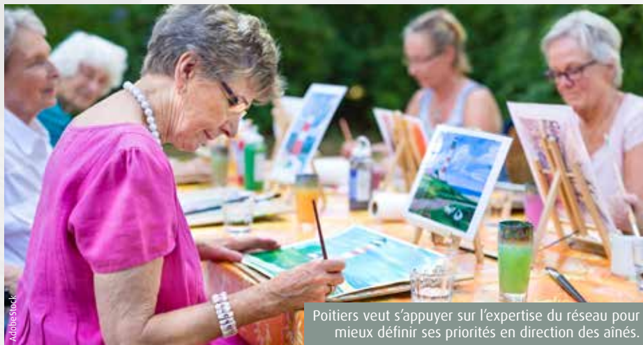
Poitiers veut s'appuyer sur l'expertise du réseau pour mieux définir ses priorités en direction des aînés.

Voulu par l'Organisation mondiale de la santé dès 2006, le bien-nommé Réseau francophone des villes amies des aînés (RFVAA) découle d'une réalité démographique : la part croissante, depuis plusieurs décennies, des seniors dans la population. Poitiers ne déroge pas à la règle. 20% de ses habitants sont âgés de 60 ans et