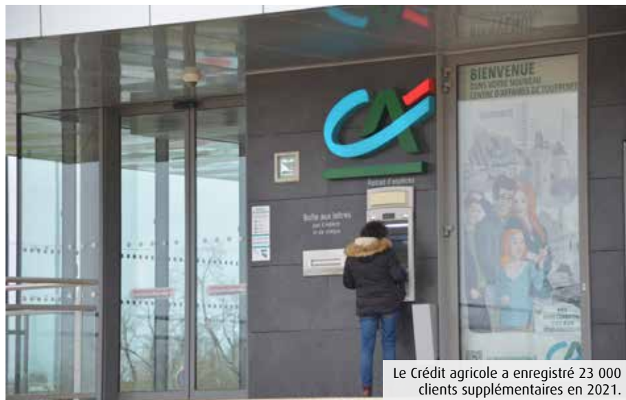
Le Crédit agricole a enregistré 23 000 clients supplémentaires en 2021.