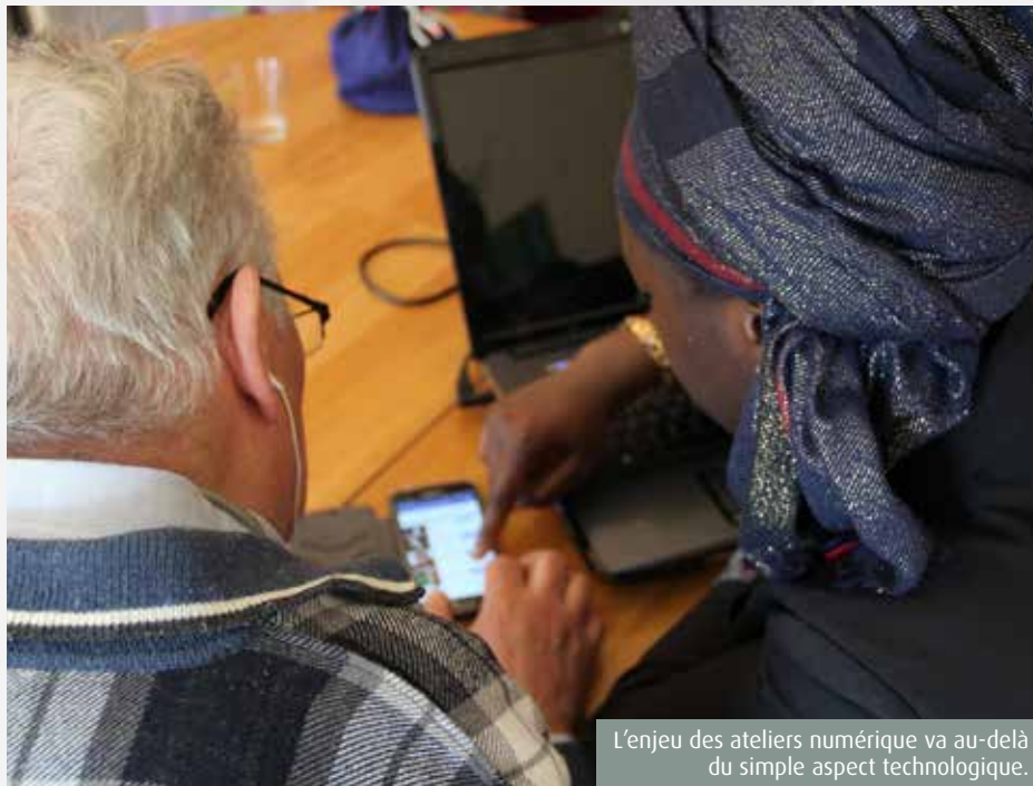
L'enjeu des ateliers numérique va au-delà du simple aspect technologique.

Parce que la maîtrise des outils numériques n'est pas intuitive pour tout le monde, les seniors sont souvent les proies faciles de l'illectronisme. Or, au-delà de la simple maîtrise d'outils technologiques, l'enjeu est sociétal.